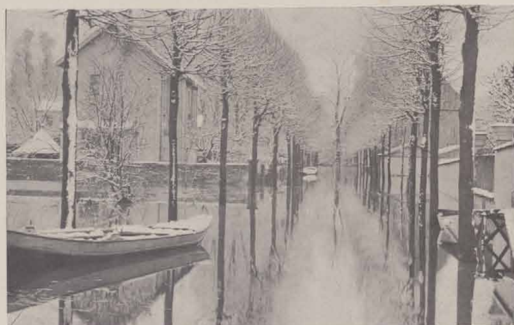
LE PERREUX. — Boulevard Sadi-Carnot.