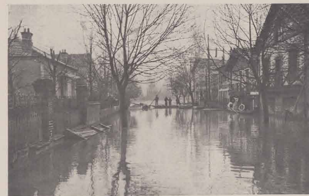
LA VARENNE-SAINTE-HILAIRE. — L'avenue de Saint-Maur.