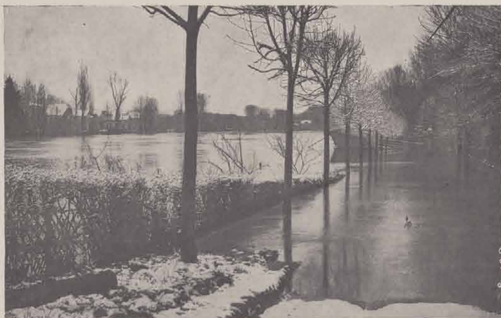
CHELLES-GOURNAY. — Promenade des Pâtes.