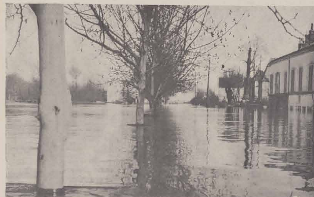
ALFORT. — Quai d'Alfort.