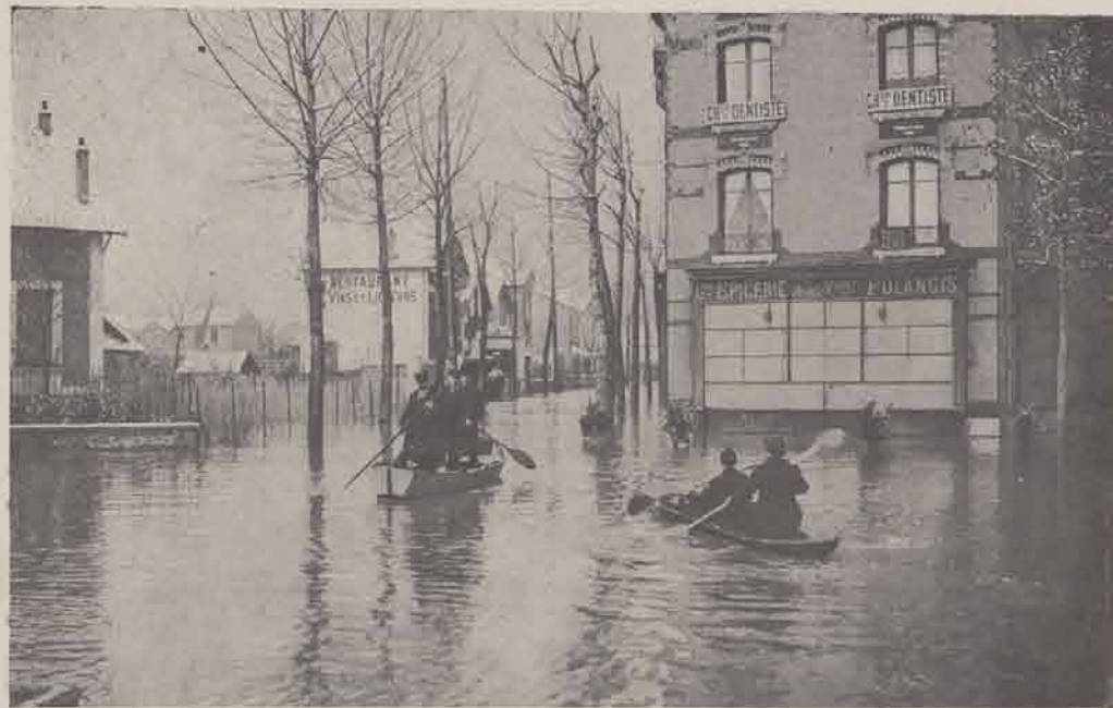
JOINVILLE-LE-PONT. — Route de l'Île.