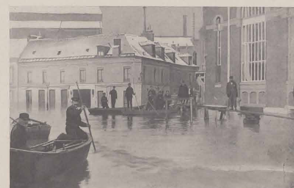
CORBEIL. — Hôtel de la Belle-Image.