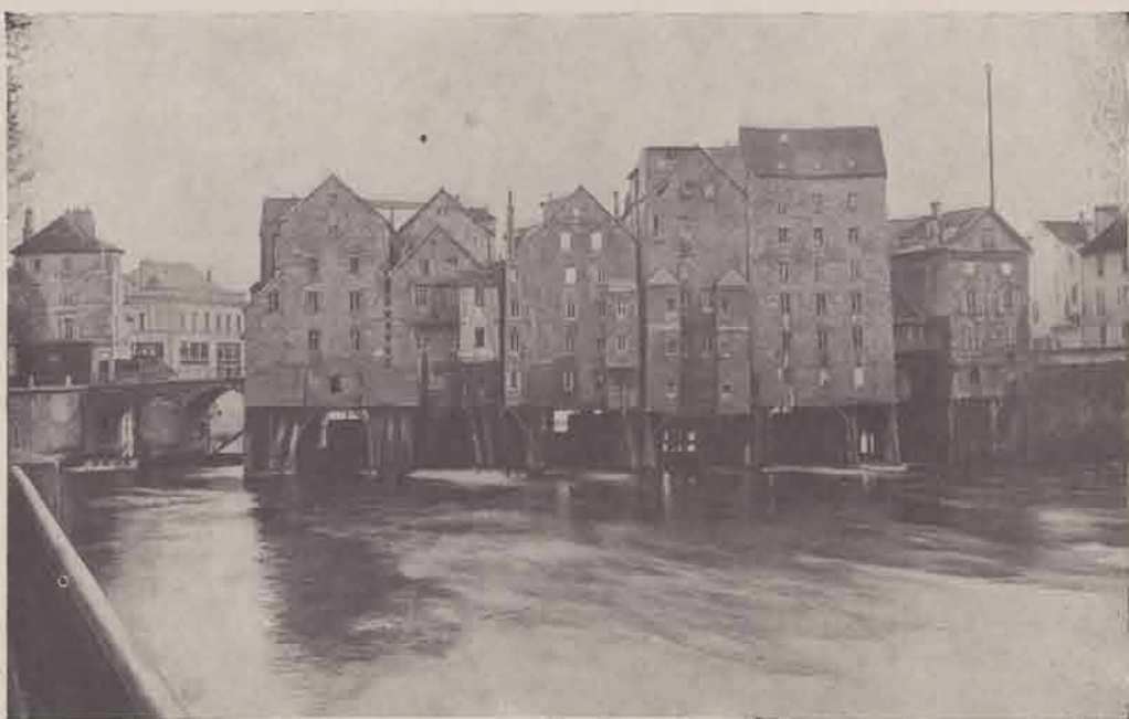
MEAUX. — Vieux Moulins (avant l'inondation)