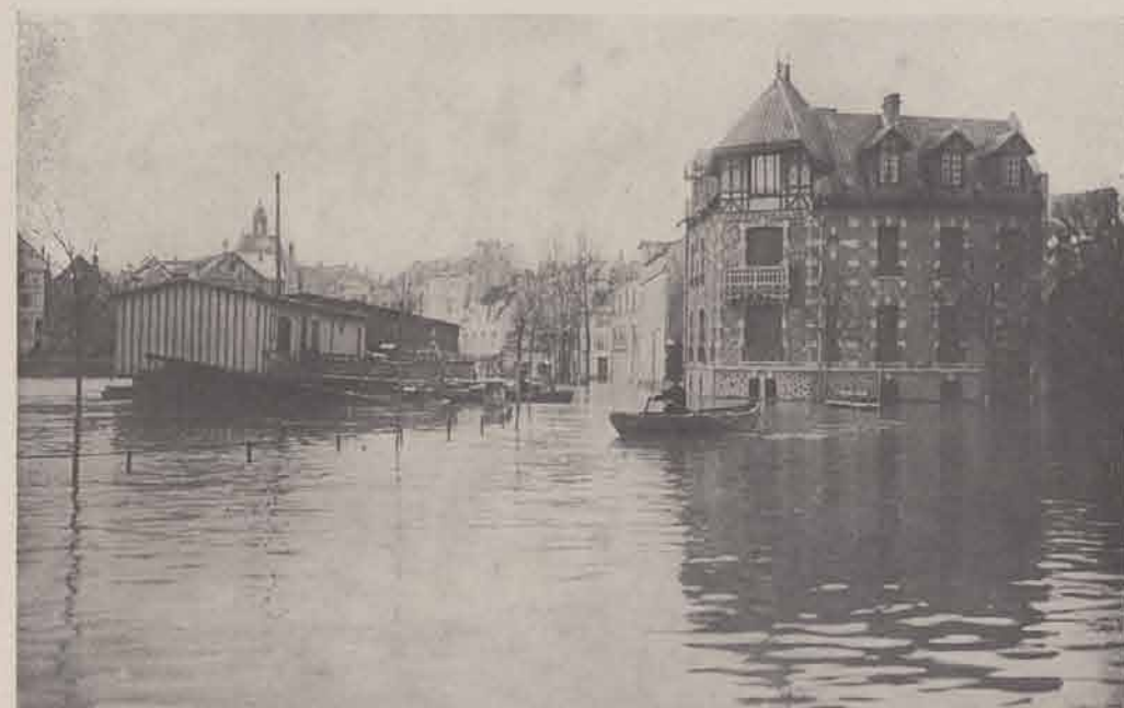
MEAUX. — Quai Thiers.