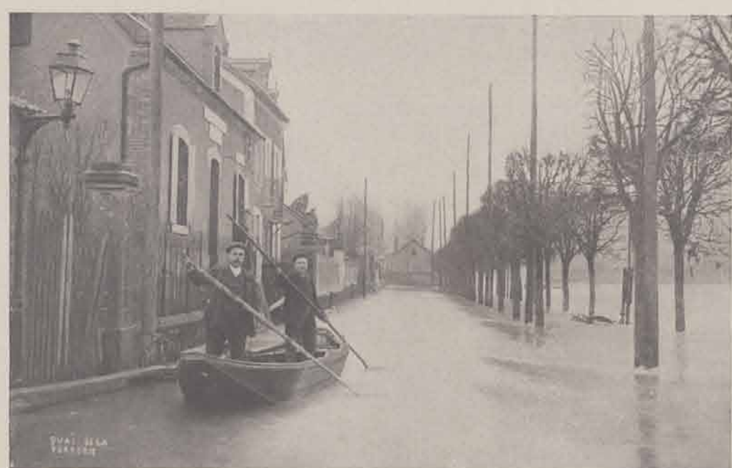
MELUN. — Quai de la Verrerie (près l'Ecluse).