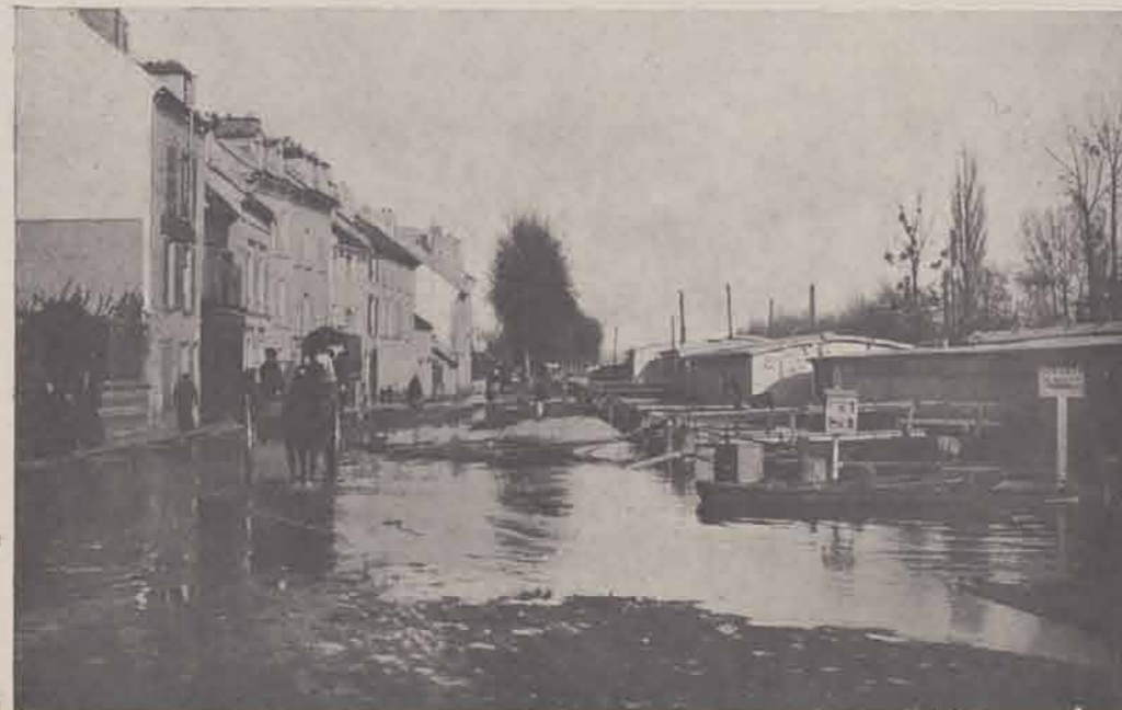
PONTOISE. — Bateaux-lavoirs sur le quai.