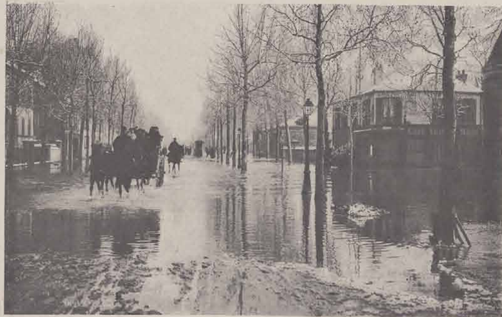
JOINVILLE-LE PONT. — Route de Bry