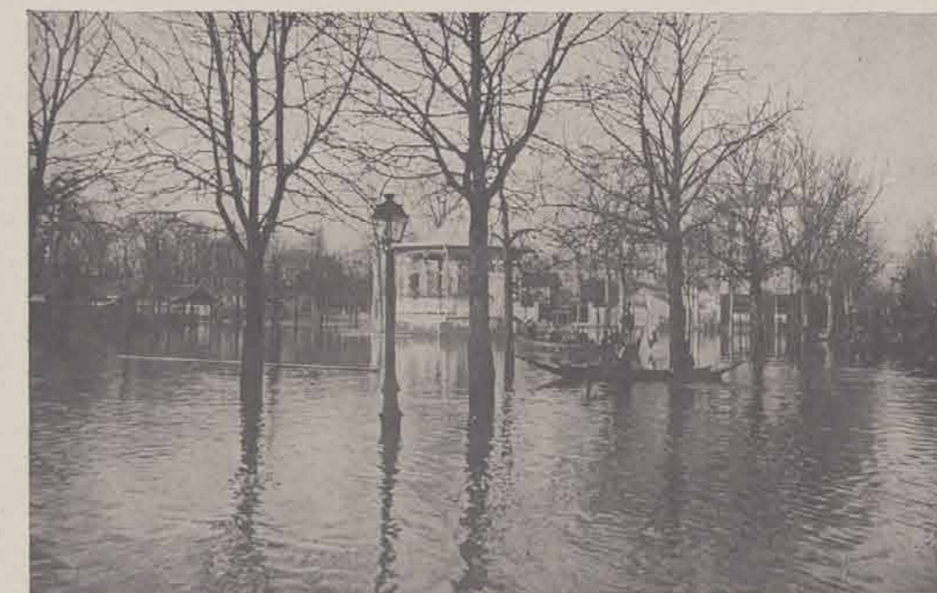
LA VARENNE SAINT HILAIRE. — La place du Marché.