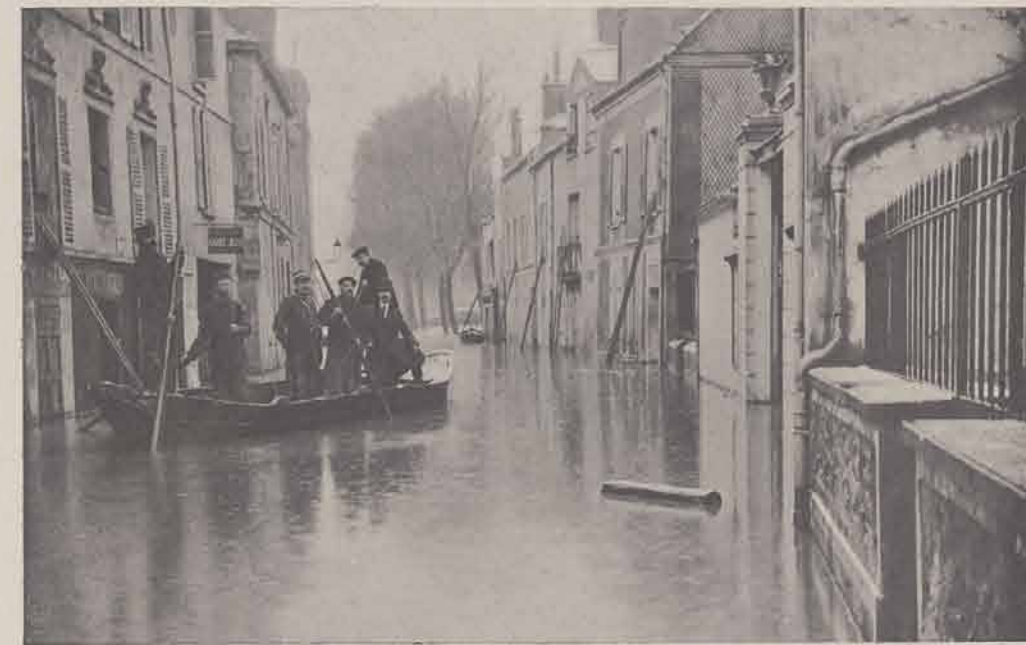
CORBEIL. — Rue de la Pêcherie.