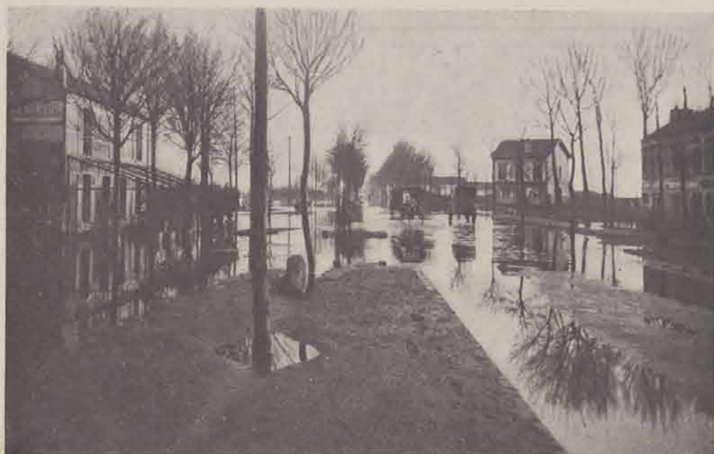
CRÉTEIL-POMPADOUR. — Route de Villeneuve-Saint-Georges.