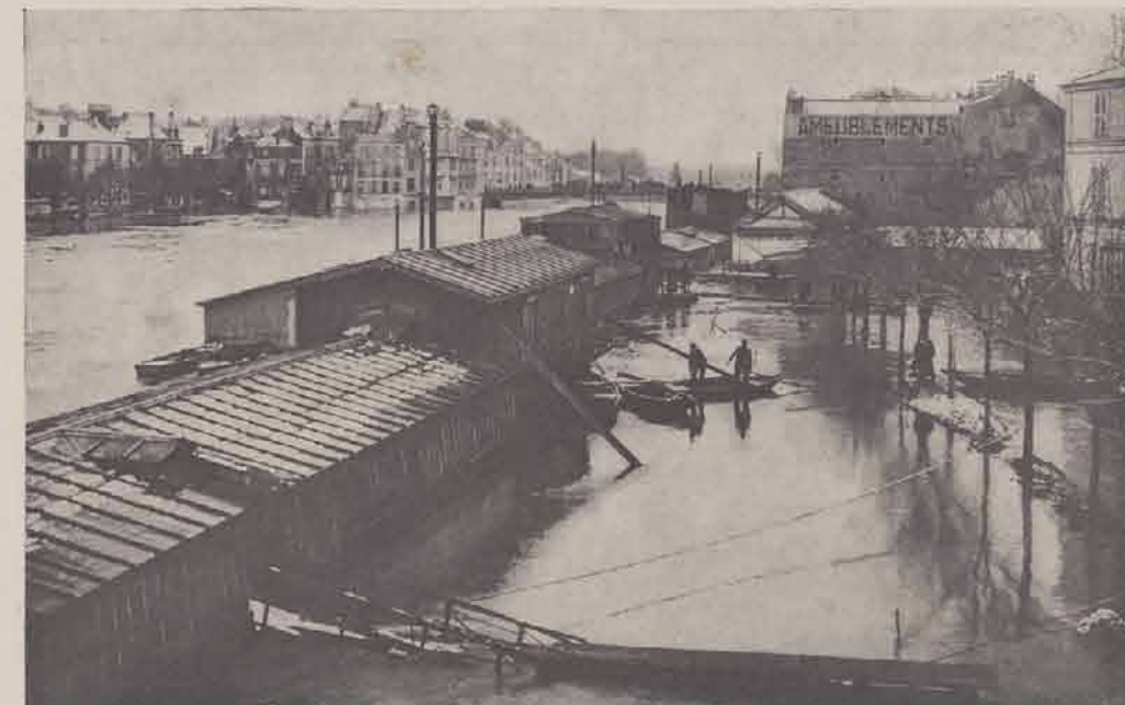
LAGNY. — Les bateaux-javoirs.