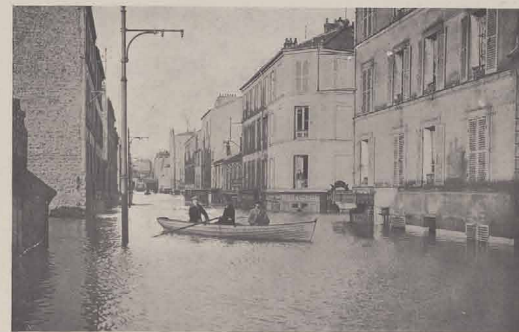
ALFORTVILLE. — La rue de Seine.