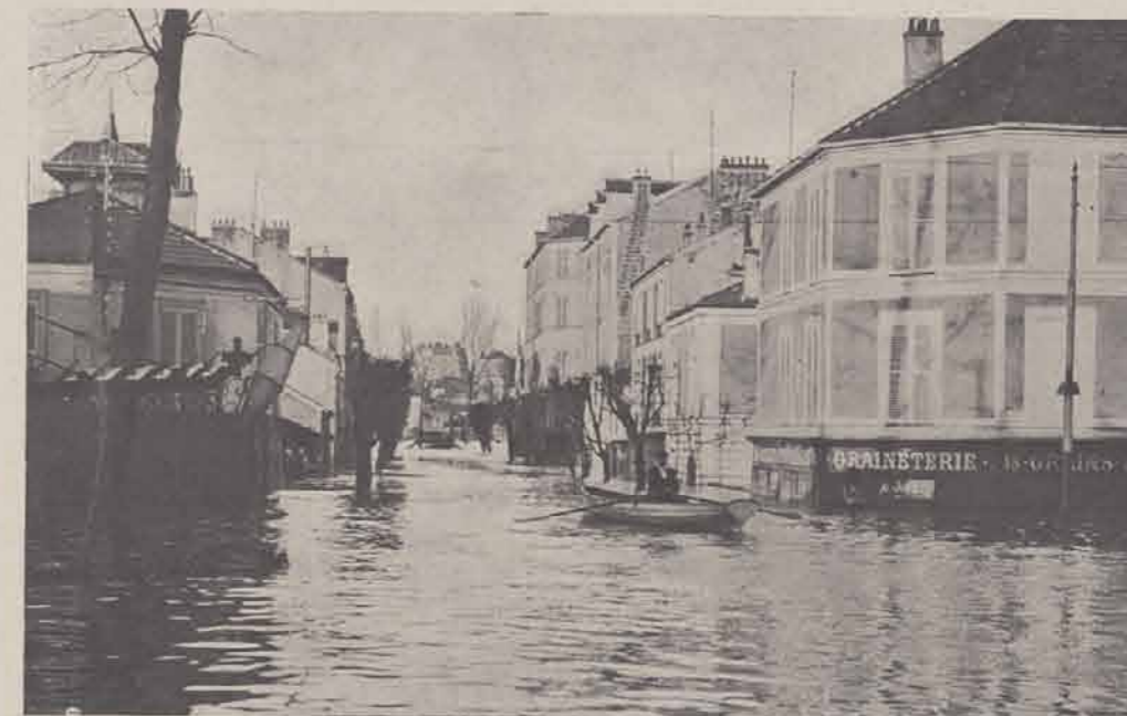
ALFORTVILLE. — La rue de Villeneuve.