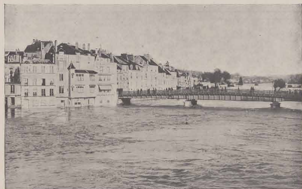
LAGNY. — Vue générale.