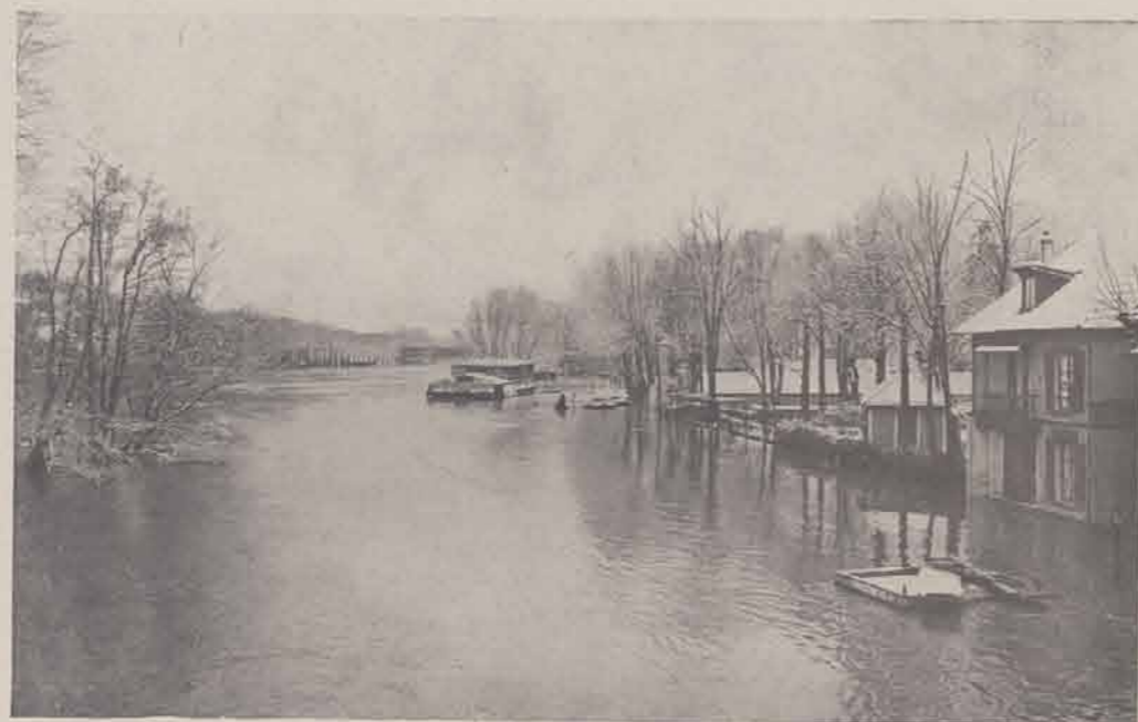
CHAMPIGNY. — La Marne en amont du Pont.