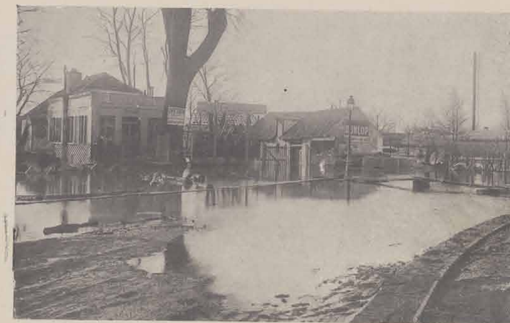
MAISONS LAFFITTE. — La rue de Paris.

A. FARIDE, Éditeur, 18-20, Boulevard Saint-Denis, PARIS.