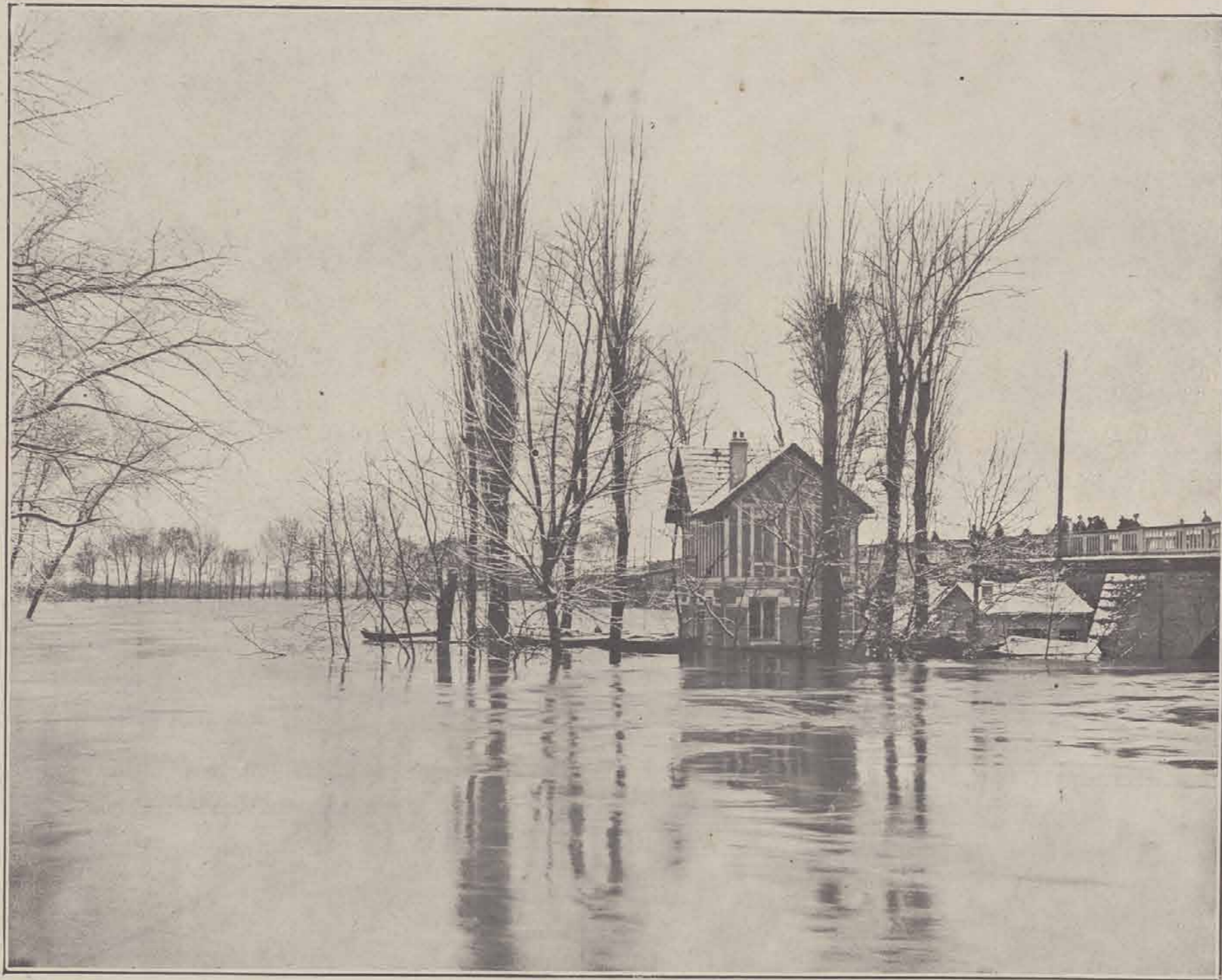
LE PONT DE POISSY.