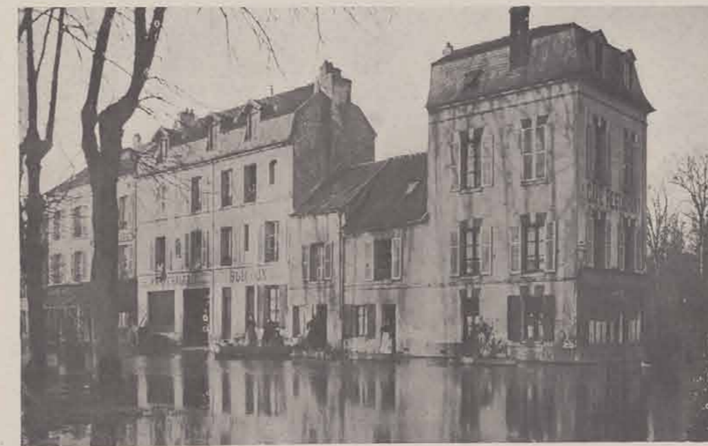
ISLE-ADAM. — Le Pâtis.