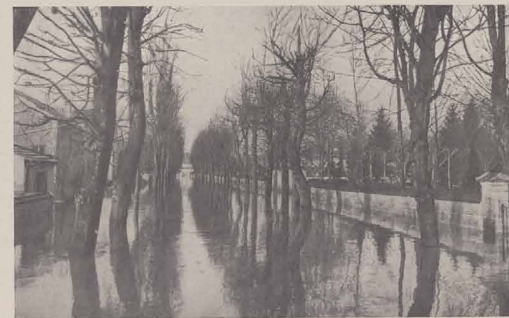
LA VARENNE SAINT-HILAIRE. — L'avenue de Chennevières.