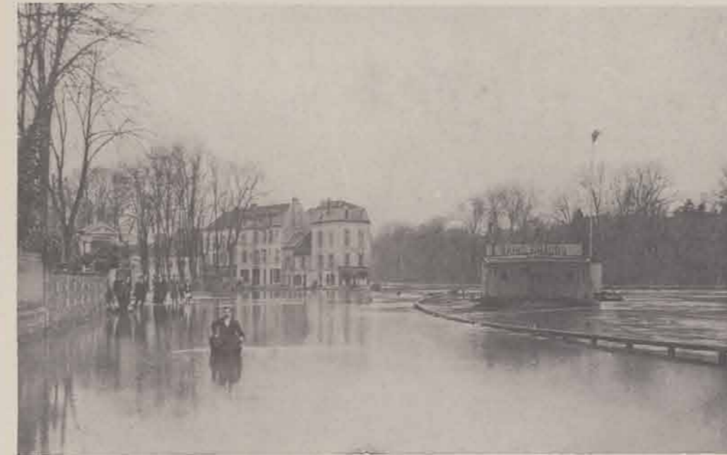
ISLE ADAM. — Les quais.