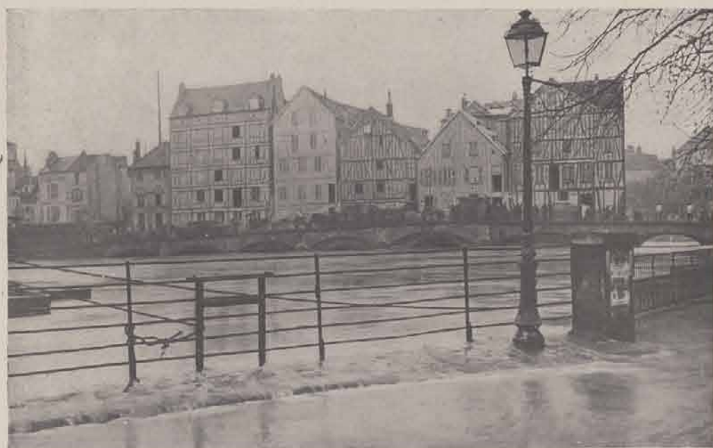
MEAUX. — Vieux Moulins.