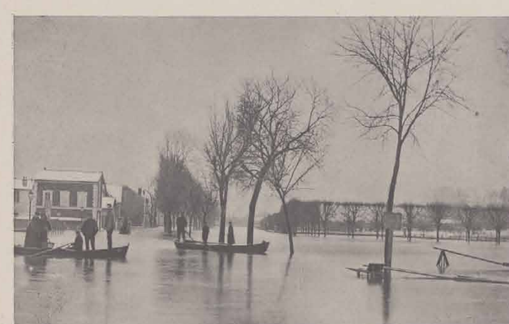
CORBEIL. — Le champ de Foire.