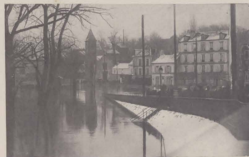
BRY-SUR-MARNE. — Place de l'Eglise