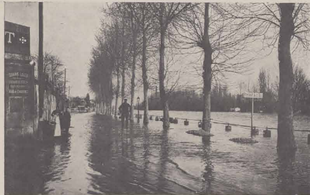
PONTOISE. — Quai du Po.huis.