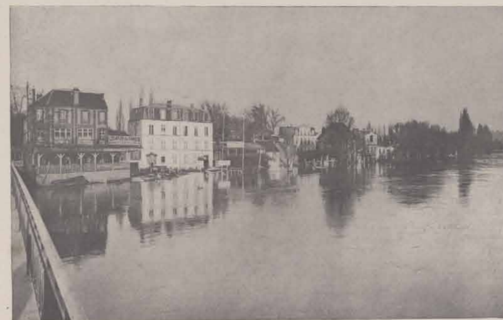
La Marne au pont de la Varenne-Saint-Hilaire.