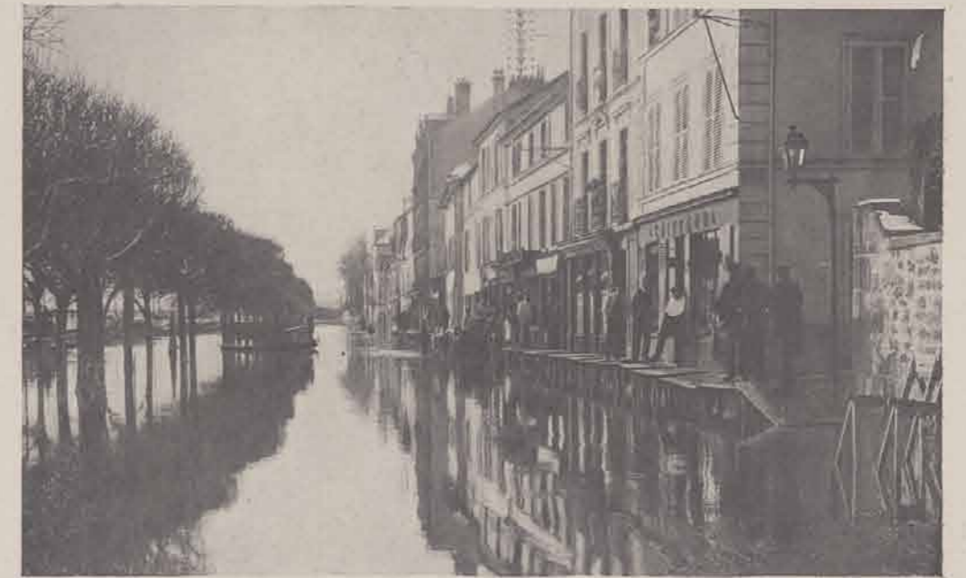
CONFLANS-SAINTE-HONORINE. — Les quais.