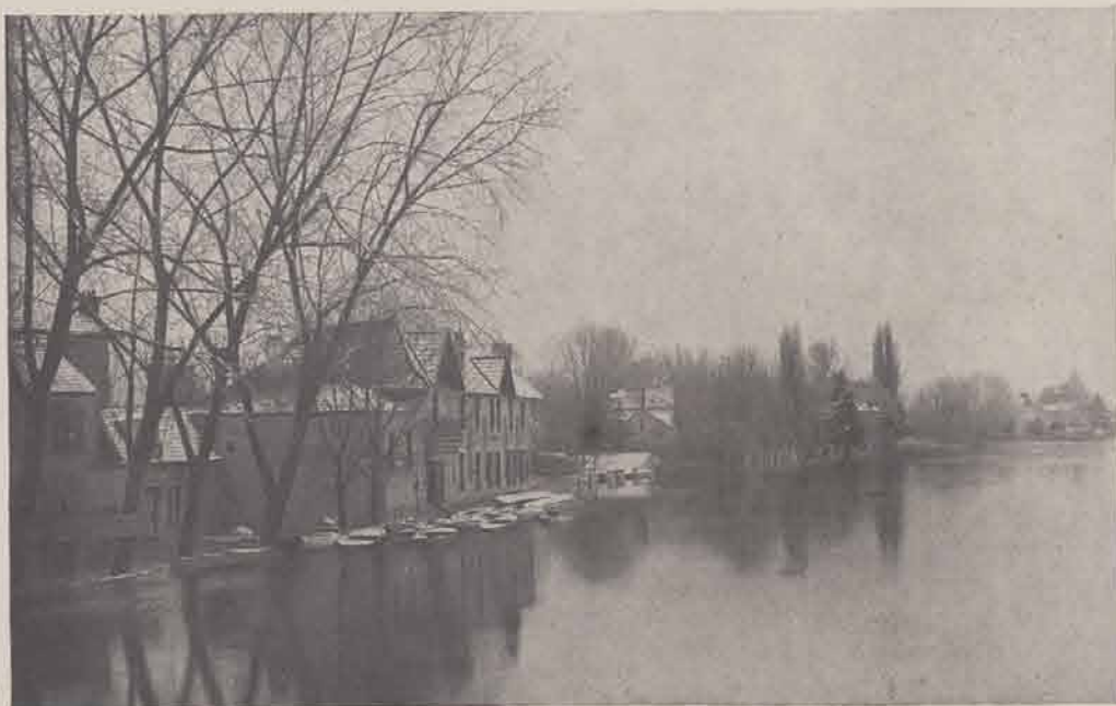
LE PERREUX. — Chemin de halage.