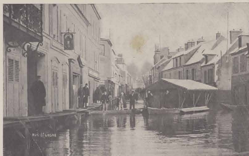
MELUN. — Rue Saint-Liesne (route de Montereau).