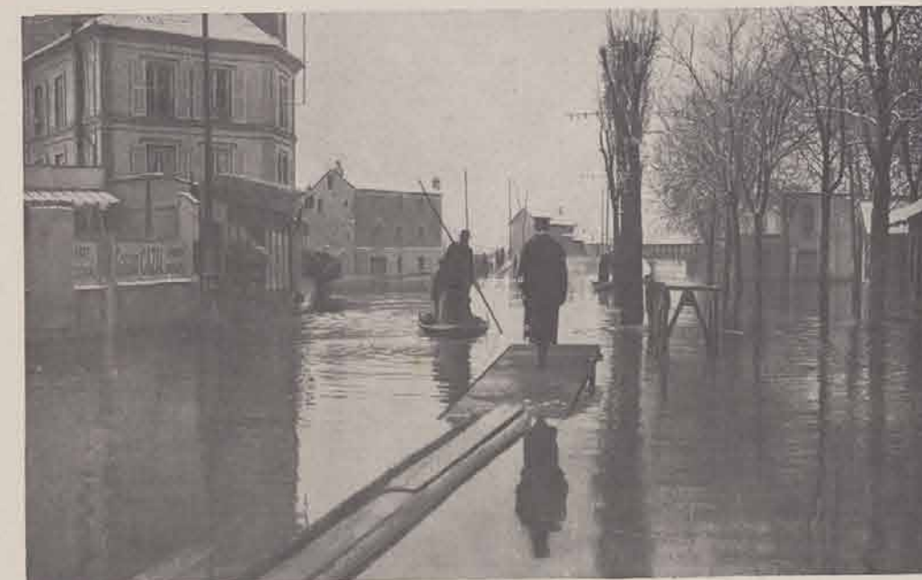
BRY-SUR-MARNE. — Place de la Mairie.