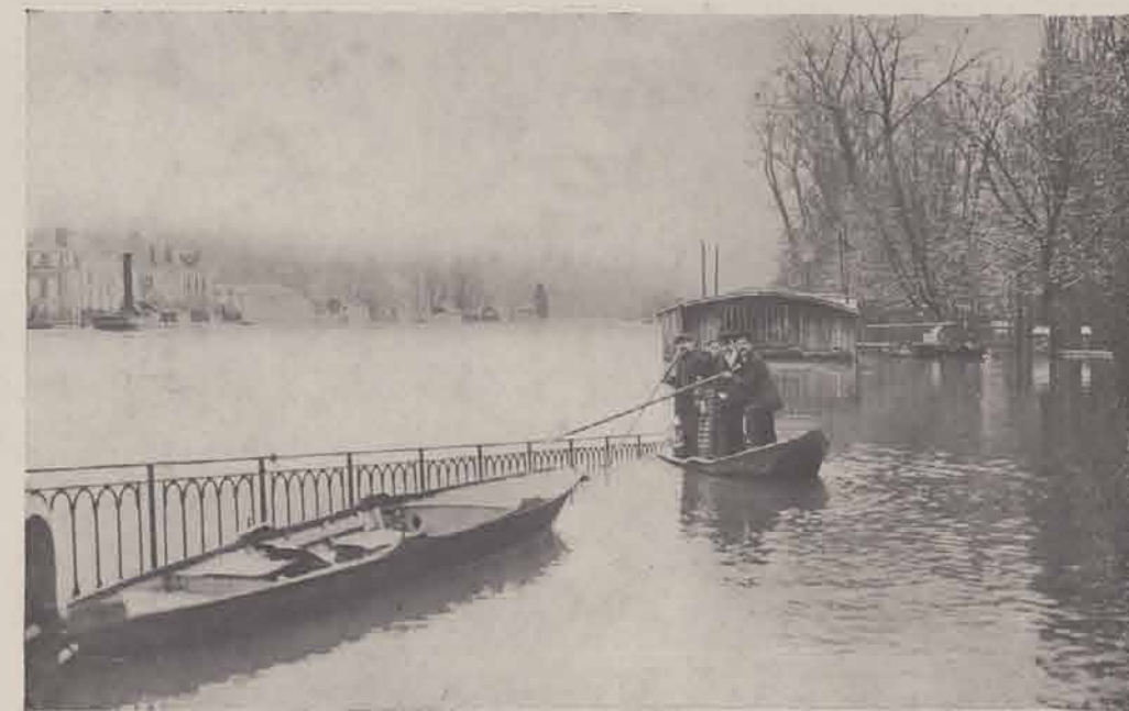
LAGNY. — Quai Saint-Père et le square