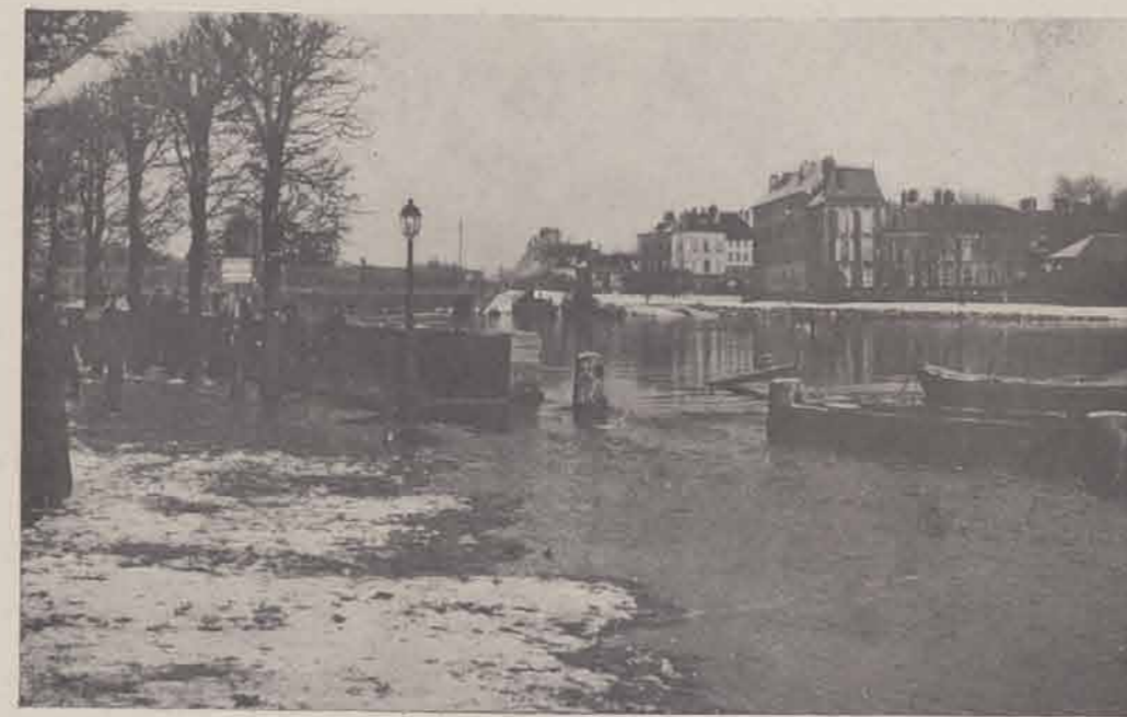
PONTOISE. — Quai du Bucherel.