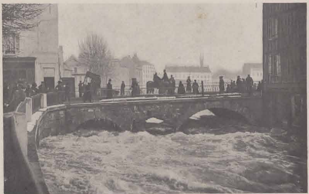
MEAUX. — Pont du Marché.