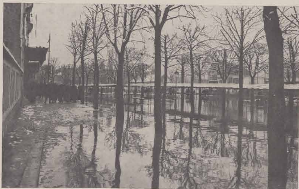
CHAMPIGNY — Place du Marché.