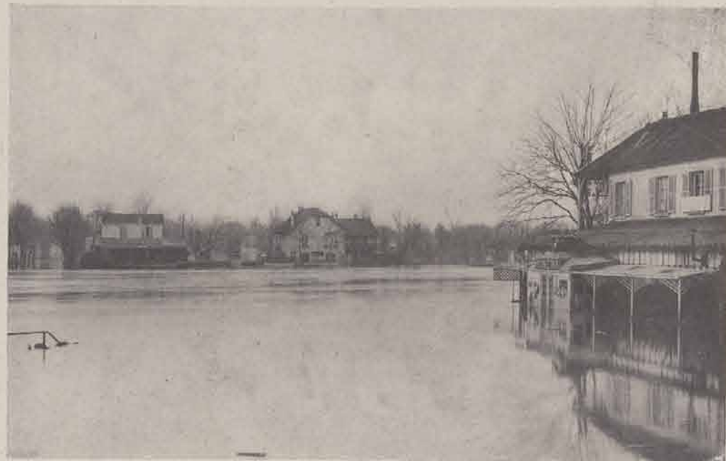
JOINVILLE-LE-PONT. — Vue prise de l'écluse.