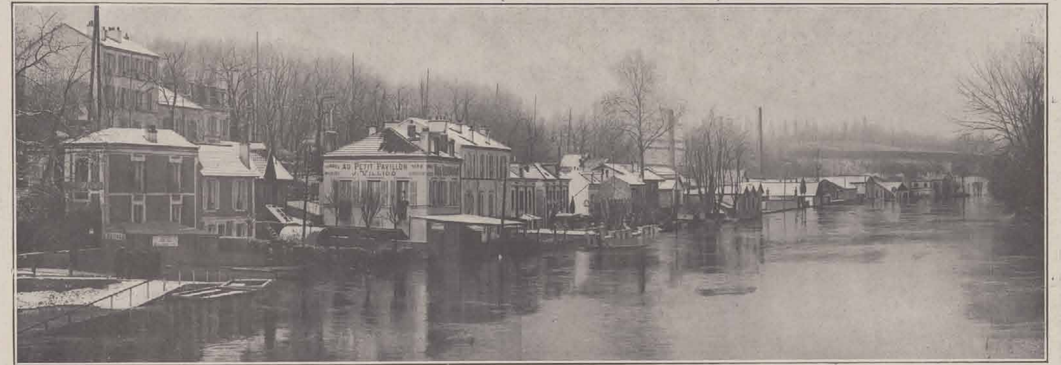
JOINVILLE-LE-PONT. — Vue panoramique