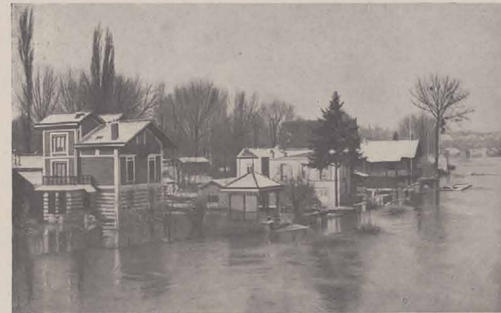
JOINVILLE-LE-PONT. — Ile Fanac.