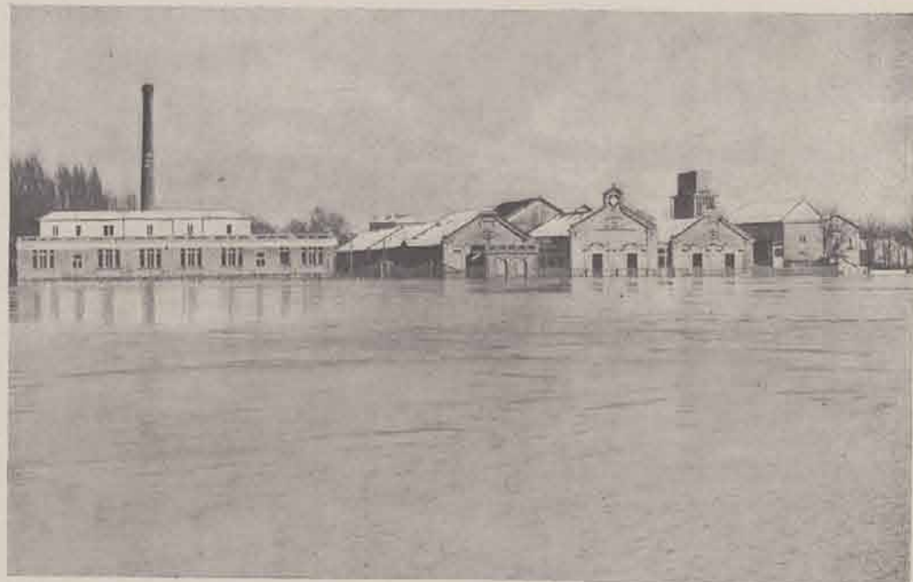
JOINVILLE-LE-PONT. — Usine Pathé.