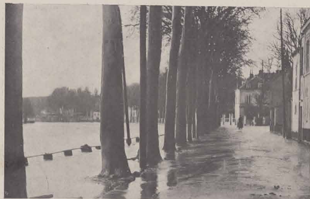
MELUN. — Quai Pasteur. — Route de Paris.