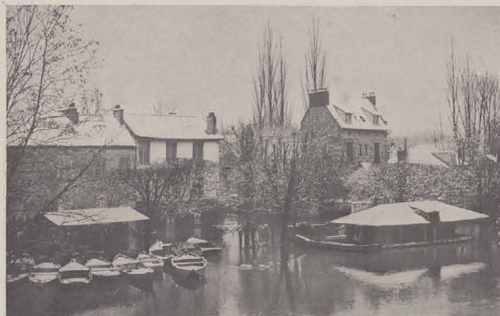
CHELLES — Quai de Marne.