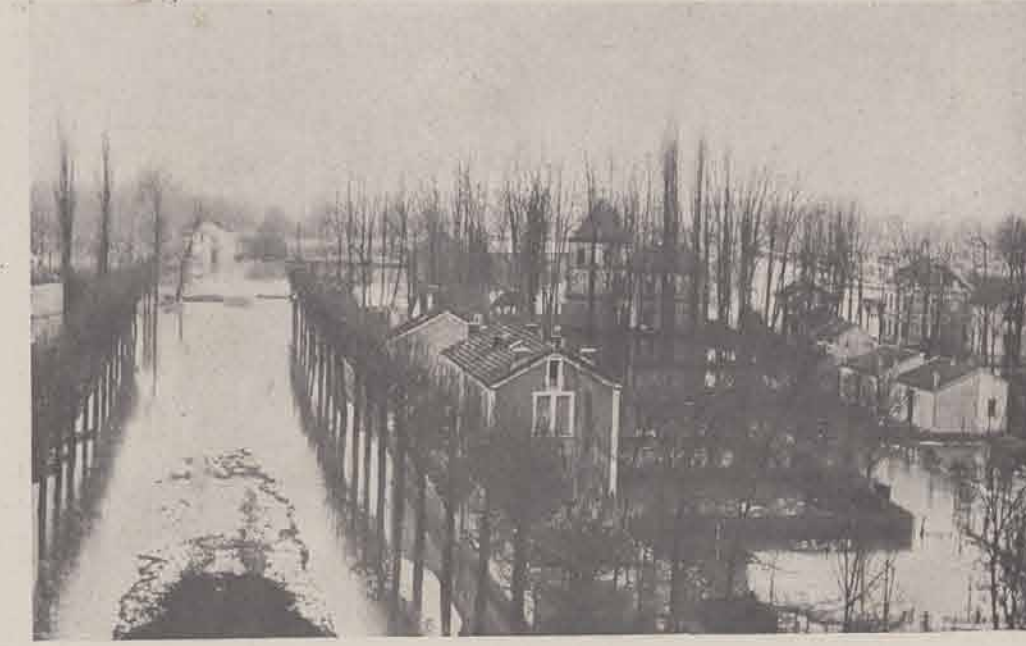
NOGENT-SUR-MARNE. — Val de Beauté.