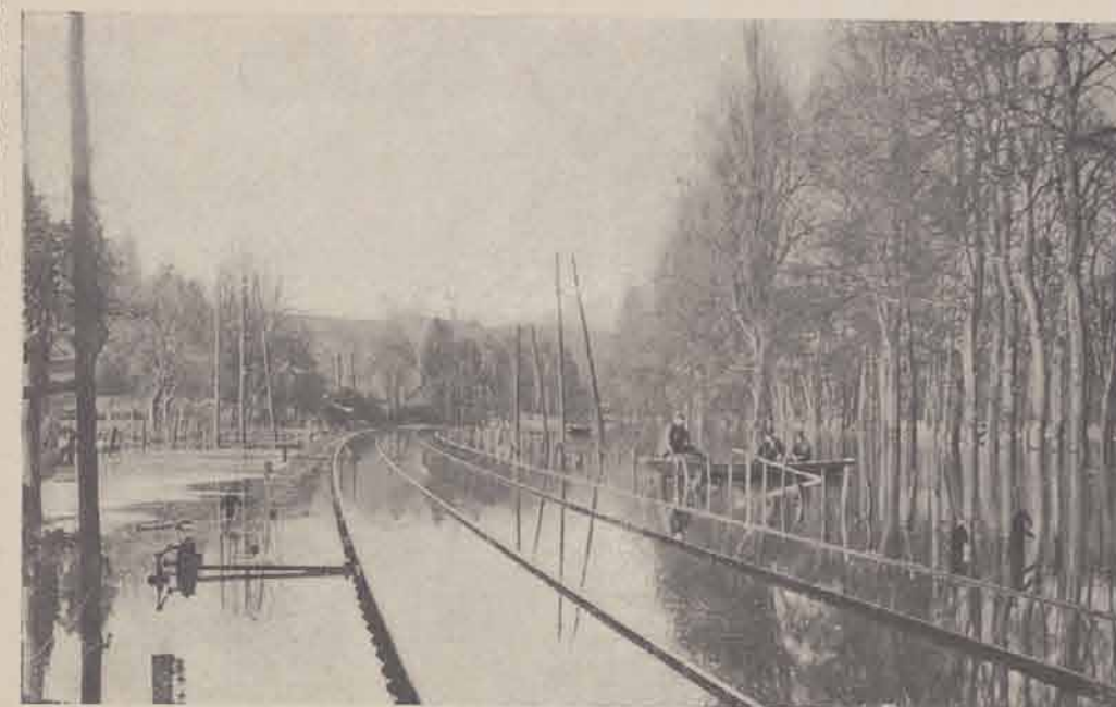
La ligne du chemin de fer entre Poissy et Villennes.