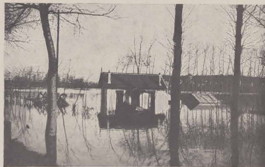
PONTOISE. — Une villa à l'Ecluse.