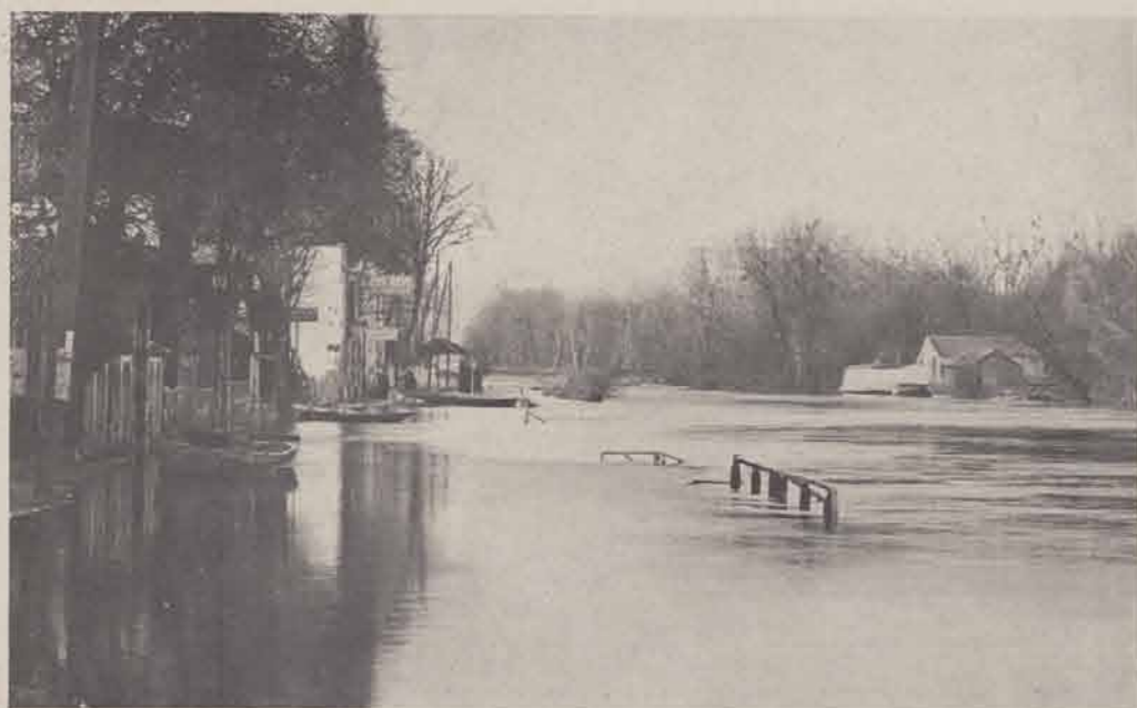
CRÉTEIL. — La Marne. — Vue prise de la passerelle