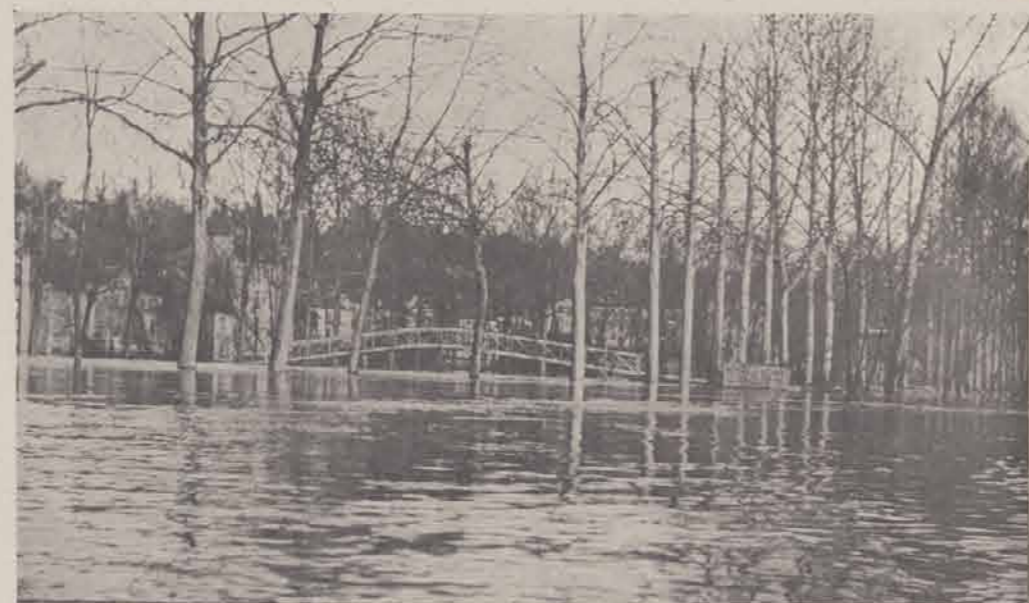
SAINT-AURICE. — La passerelle.