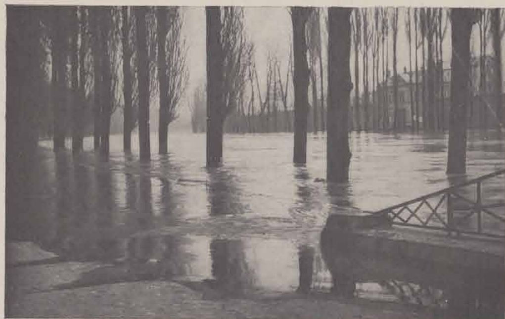
MELUN. — La promenade de Vaux-le-Pénil.