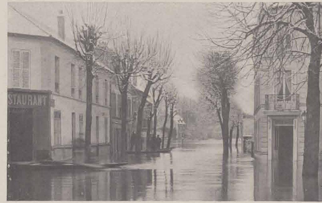
BRY-SUR-MARNE. — Avenue de Rigny