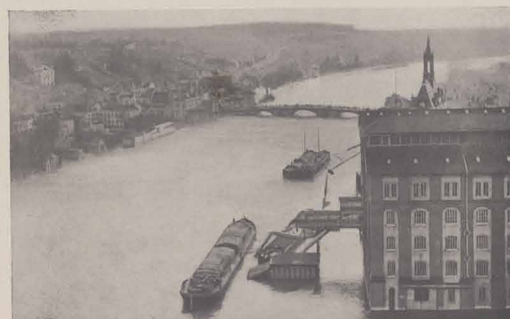
CORBEIL. — Les Grands Moulins.