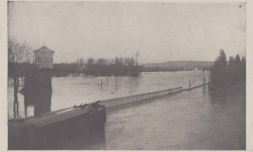
Le champ de courses de Maisons Laffitte.