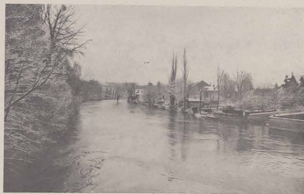
CHAMPIGNY. — La Marne en aval du Pont.