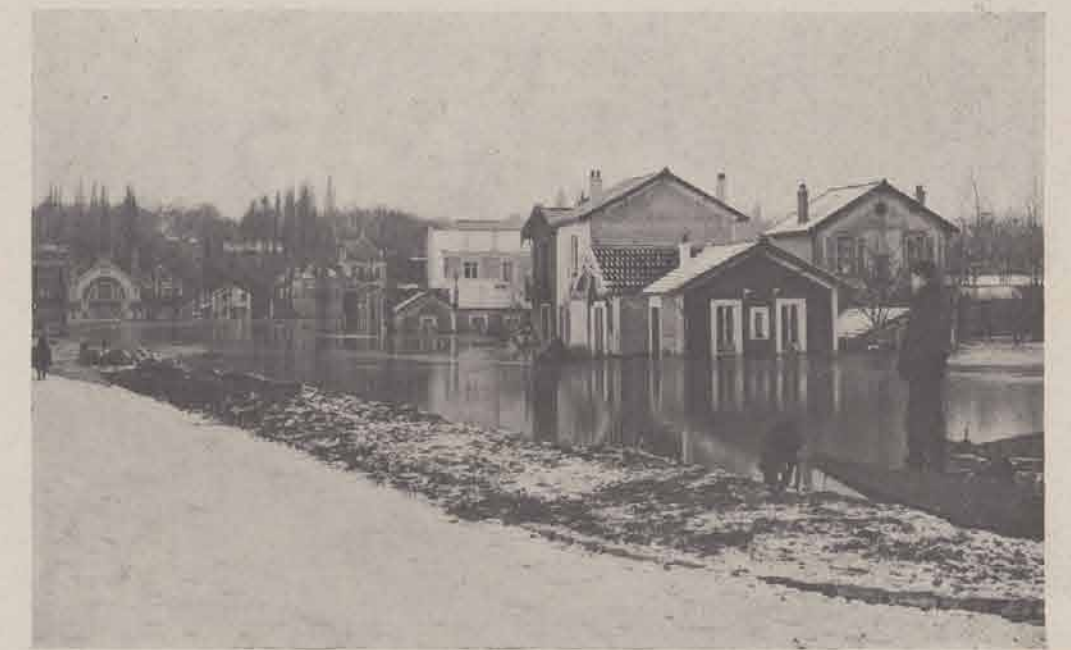
JOINVILLE-LE-PONT. — Polangis.