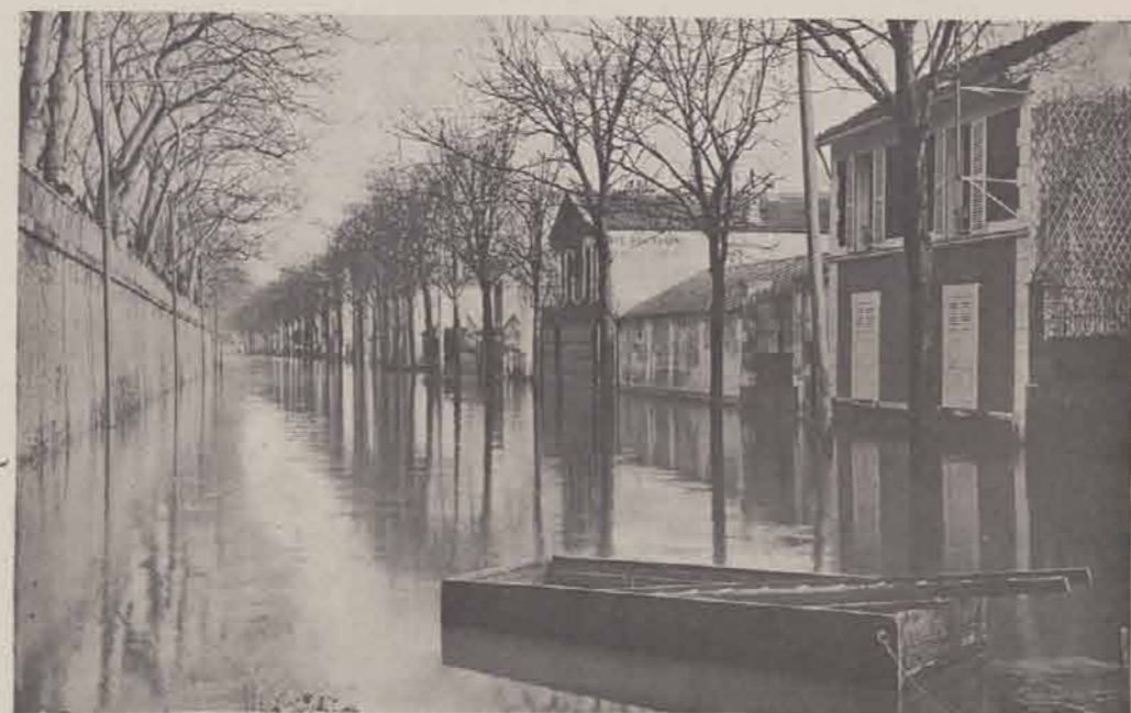
SAINT-AURICE. — Grande-Rue.