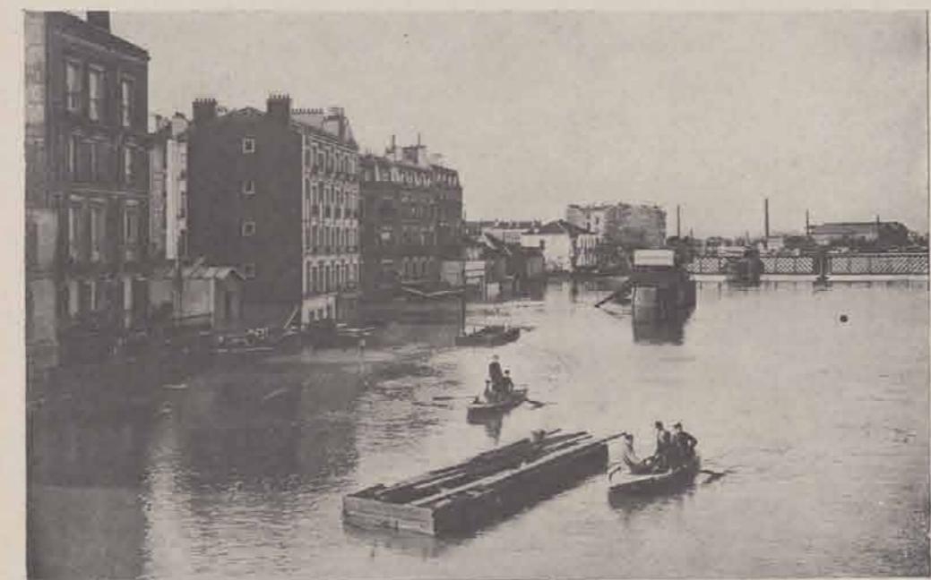
ALFORTVILLE. — Vue prise du pont du Chemin de Fer.