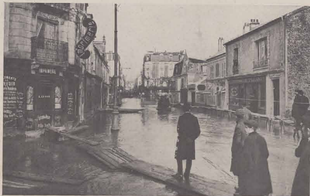
CHAMPIGNY. — La rue Mignon.