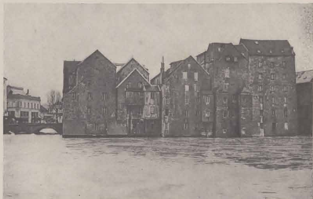
MEAUX. — Vieux Moulins (en aval).