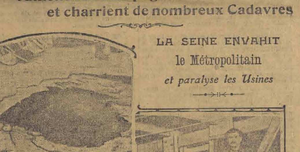
LA SEINE ENVAHIT le Métropolitain et paralyse les Usines

Les Cours de l'eau débordés ruinent les Campagnes désolées et charrient de nombreux Cadavres