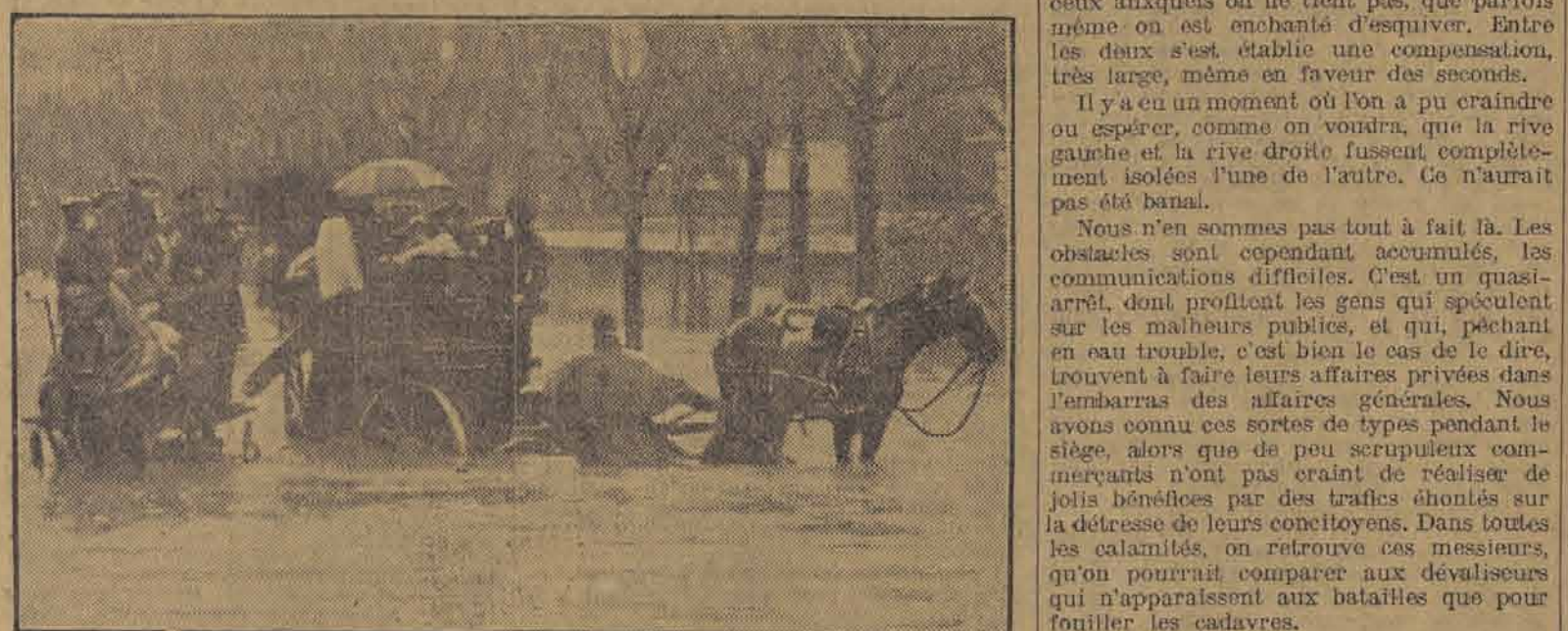
RUE DE LA CONVENTION. — Une prolonge d'artillerie procède au sauvetage.

Un tragique accident s'est produit à huit heures et demie du matin. L'inondation ne laisse pas que d'avoir de curieuses répercussions. Je ne parle pas du retard causé aux représentations de Châtelet, retard qui a déjà causé plusieurs suicides, ainsi qu'il appert de l'enquête faite sur les infortunés qui se sont précipités ces derniers jours dans la Seine; mais en outre cette inondation fait manquer un grand nombre de rendez-vous.