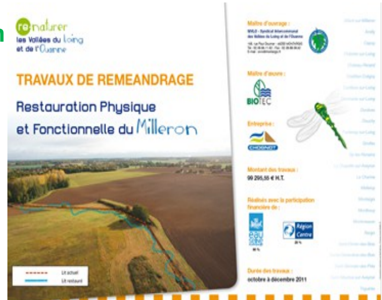
Panneau de communication sur une opération de restauration de cours d'eau