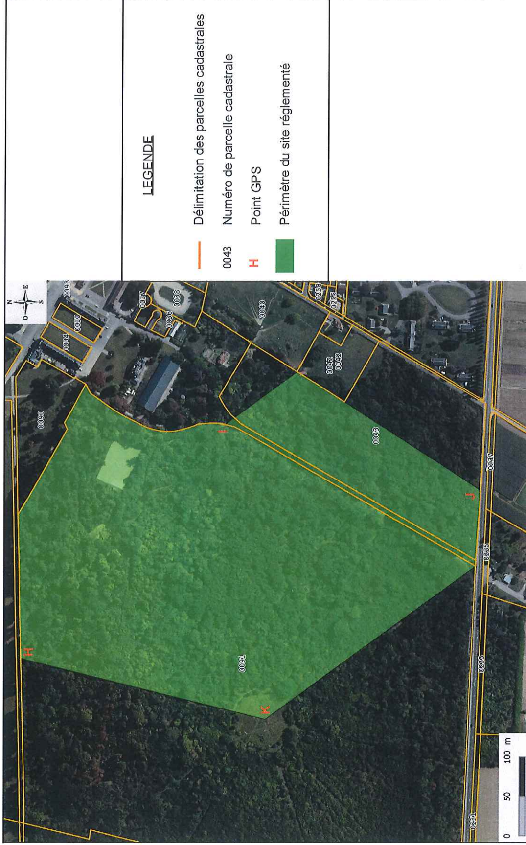
Périmètre du site d'intérêt géologique du domaine de Grignon (secteur sud) faisant l'objet du présent arrêté - Fond IGN Bd Ortho