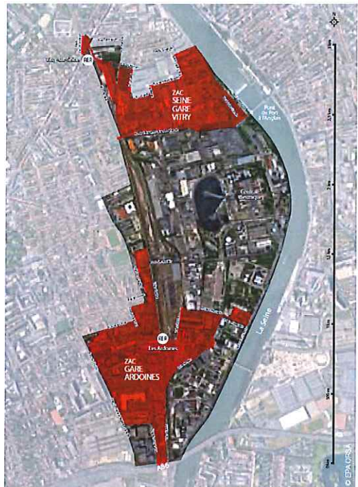
Périmètre des Ardoines, de la ZAC Seine Gare Vitry et de la ZAC gare Ardoines

Au total, le pétitionnaire estime que le quartier peut ainsi être amené à accueillir 10 000 nouveaux habitants et 4 000 emplois.