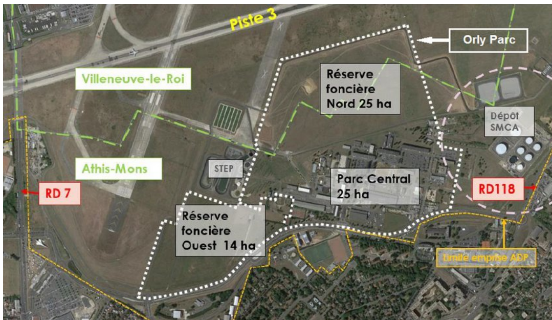
Figure 1: Situation de l'ensemble Orly Parc (vue satellite 2018)

Par ailleurs, le site est traversé par deux canalisations de transport de kérosène et d'hydrocarbures.