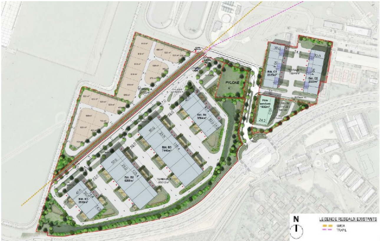
Figure 2: Plan masse prévisionnel