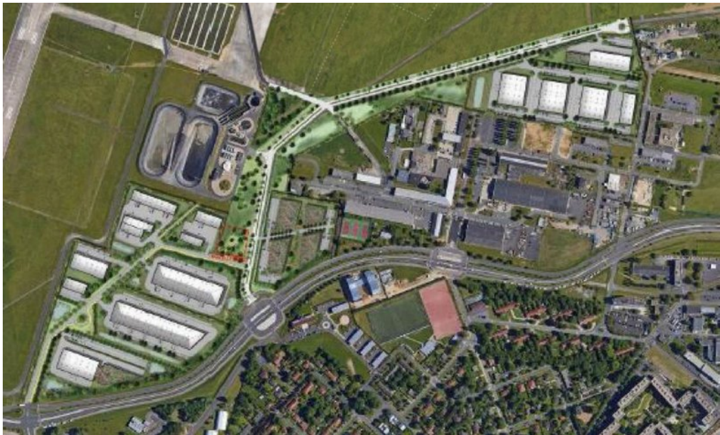
Figure 3: variante n°1, plus économe en voie de desserte, abandonnée

Enfin, les espaces verts en situation future, aménagés dans les résidus de la desserte automobile ou sur les servitudes, ne font l'objet d'aucune description approfondie. Par conséquent, leur intérêt écologique n'est pas analysé.