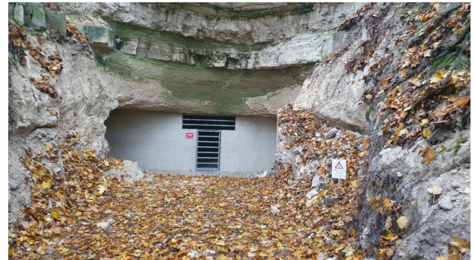
Entrée principale de la cavité après travaux