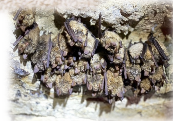
GUIDE TECHNIQUE PRISE EN COMPTE DES CHAUVES- SOURIS DANS LES INFRASTRUCTURES FERROVIAIRES