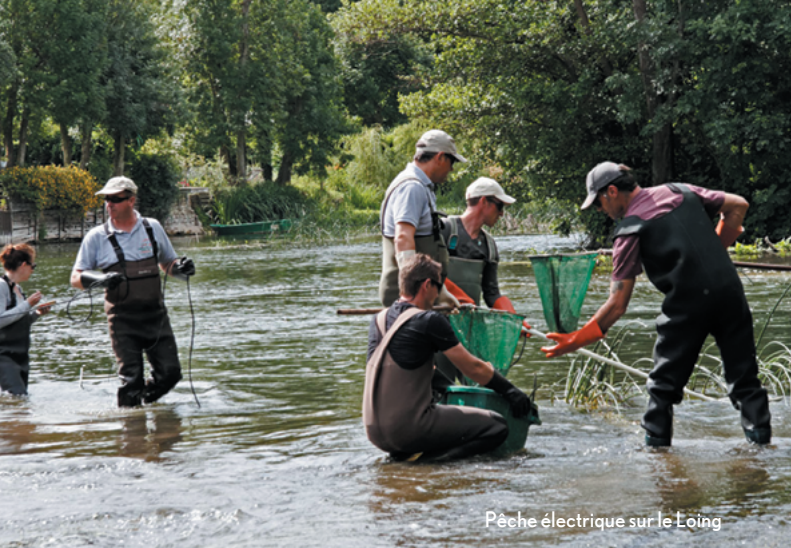
Pêche électrique sur le Loing