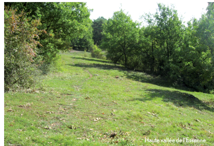
Haute vallée de l'Essonne

Toutes les informations sont disponibles auprès de la direction régionale et interdépartementale de l'environnement et l'énergie d'Île-de-France (DRIEE) et des directions départementales des territoires (DDT) (cf. coordonnées au dos de la plaquette).