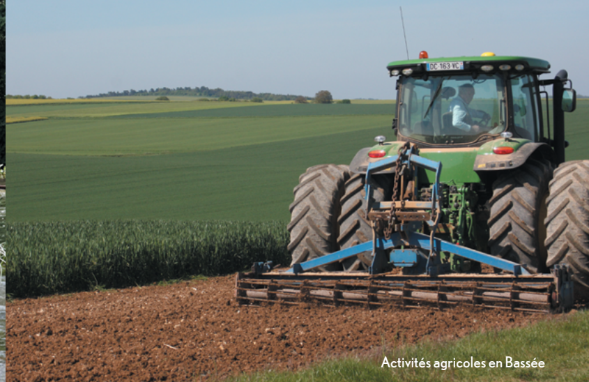
Activités agricoles en Bassée