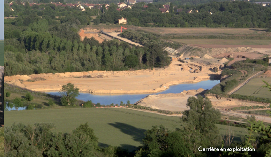
Carrière en exploitation