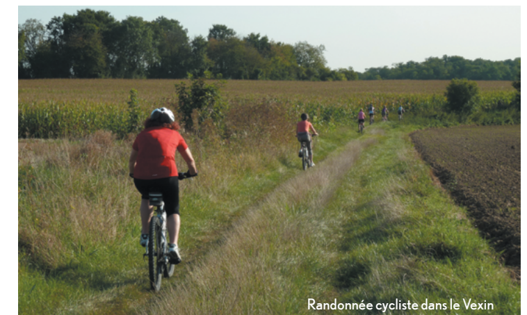
Randonnée cycliste dans le Vexin

L'étude des incidences doit débiter le plus en amont possible puisqu'elle fait partie intégrante du processus de conception du projet. Il est donc indispensable pour le maître d'ouvrage de se poser, le plus tôt possible, la question de l'incidence au titre de Natura 2000.