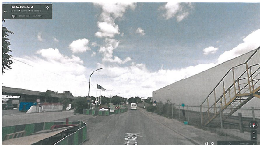
Exemple d'espaces publics actuels du secteur Seine Cavell

Grâce à l'appel à projets « Territoire à énergie positive pour la croissance verte », les nouveaux espaces publics réalisés autour du collège constitueront un bouquet d'interventions au sein duquel chaque brique contribue à la transition énergétique et écologique avec :