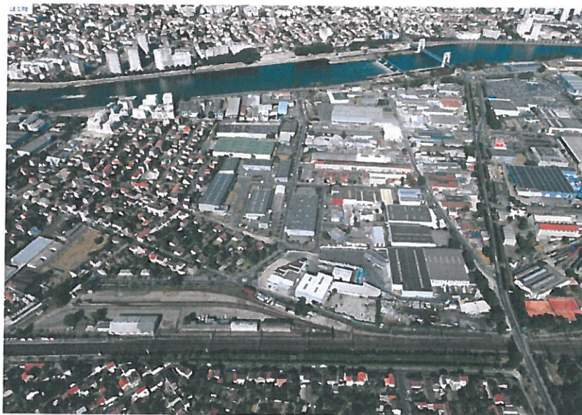
Vue aérienne de la ZAC Seine Gare Vitry

L'aménagement de la ZAC Seine Gare Vitry à Vitry-sur-Seine démarre par l'ouverture à la rentrée 2017 d'un collège réalisé sous maîtrise d'ouvrage du Conseil Départemental du Val de Marne.