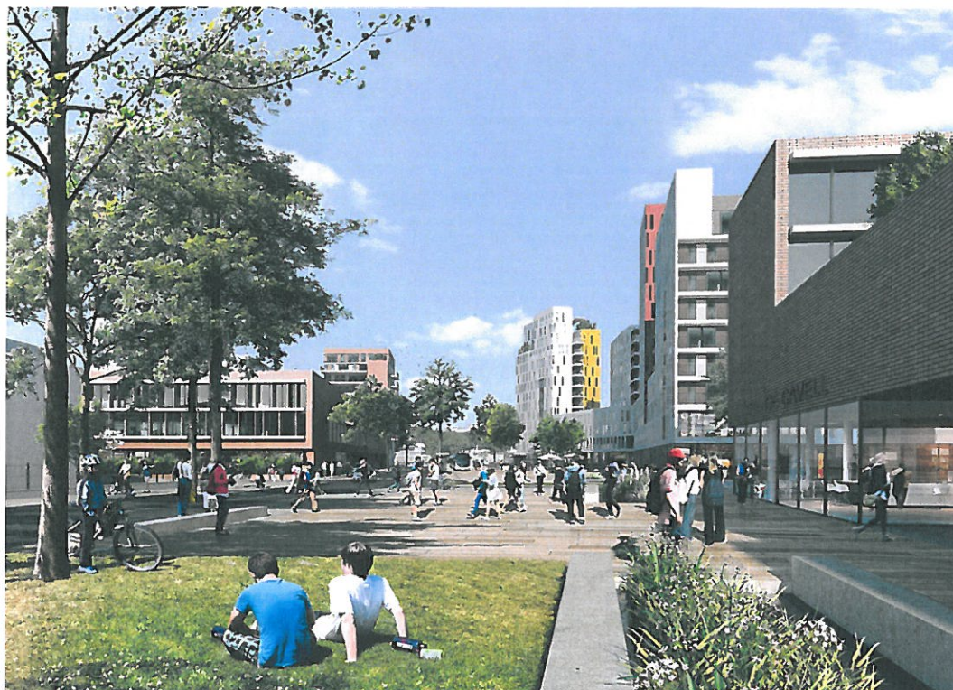
Les espaces publics aux alentours du collège Édith Cavell