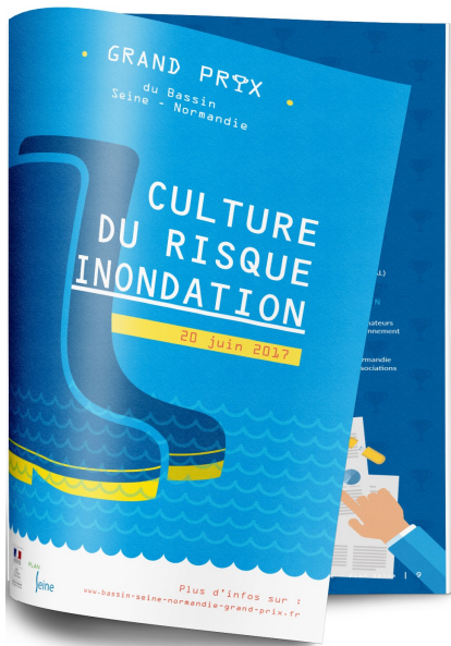
Diffusion du recueil des candidatures