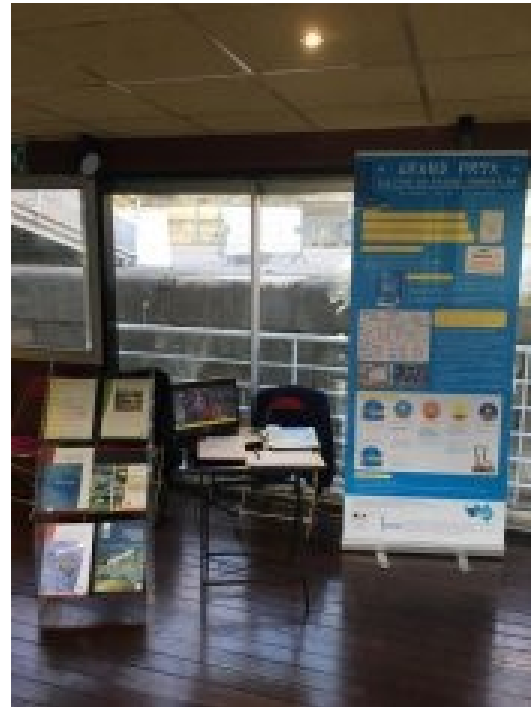
Journée nationale des IRISES – nov 2017