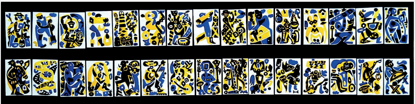
Fresque réalisée par Ricardo Mosner

Ces 2 installations sont complétées par l'affichage d'une phrase grand format sur un local à proximité de la seconde statue. Cette phrase a été sélectionnée par des élèves de Bagneux.