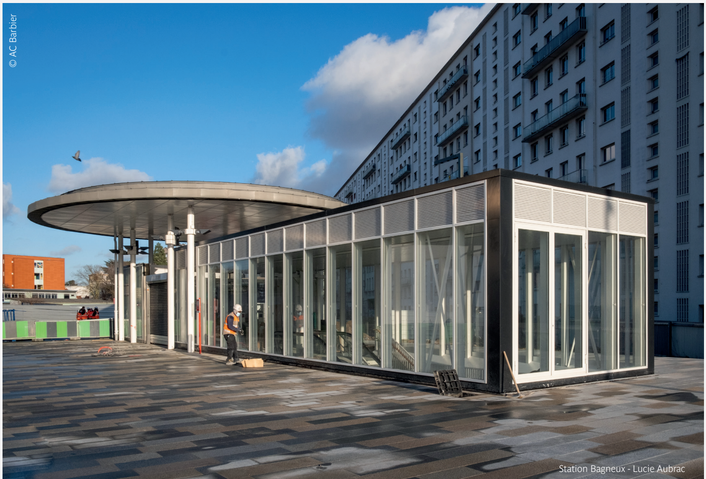
Station Bagneux - Lucie Aubrac