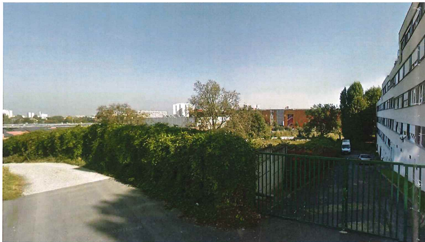
2/ Chemin des Soudoux, août 2015