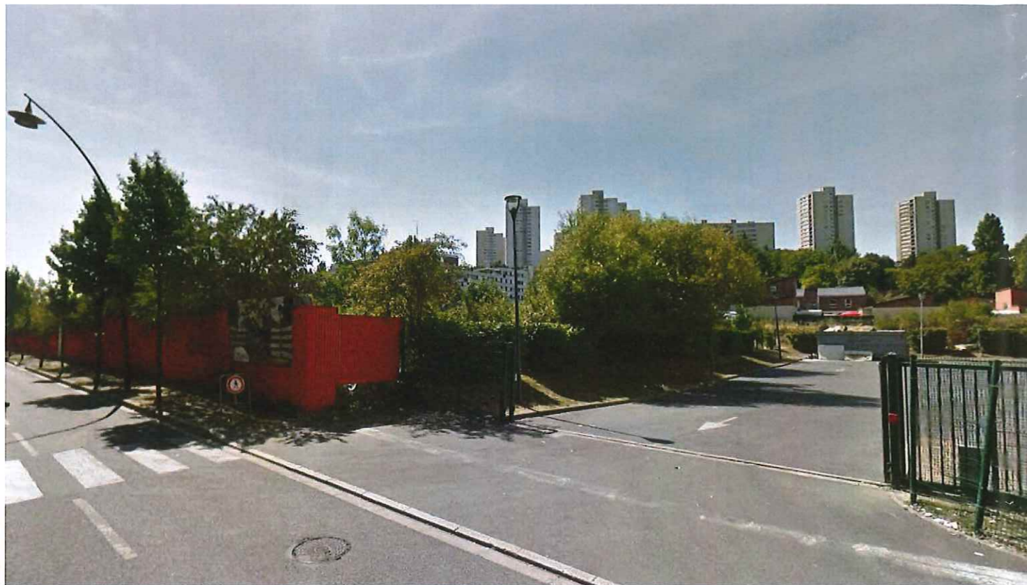
1/ Rue de Lisbonne, août 2015