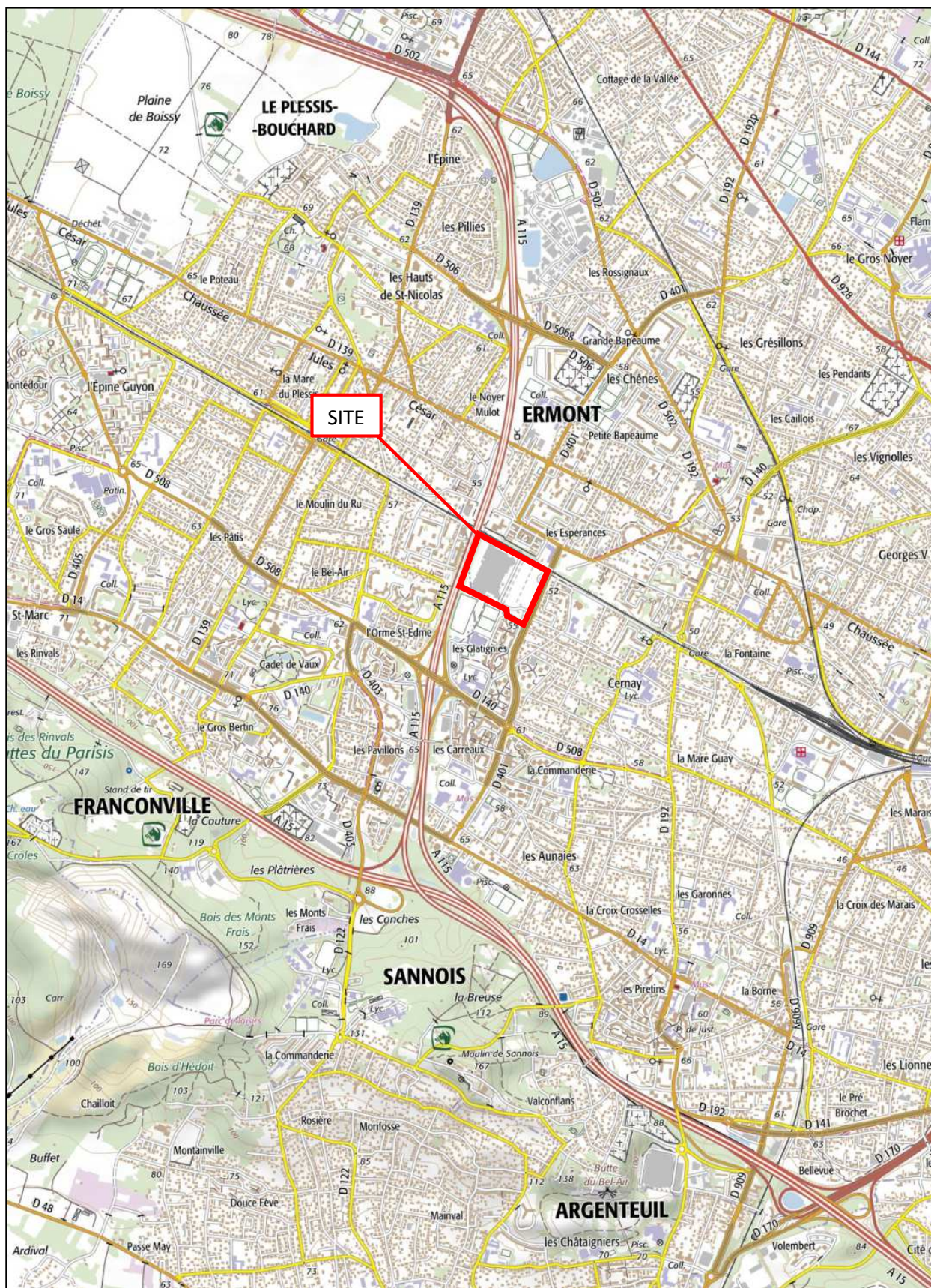
Annexe 2 - Plan de situation du projet Format : A4 Echelle : 1/25 000 ème