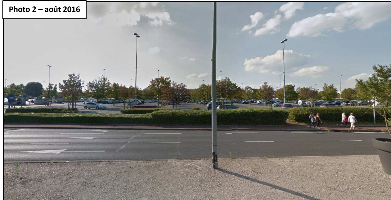
Annexe 3 – Photographies de la zone d'implantation