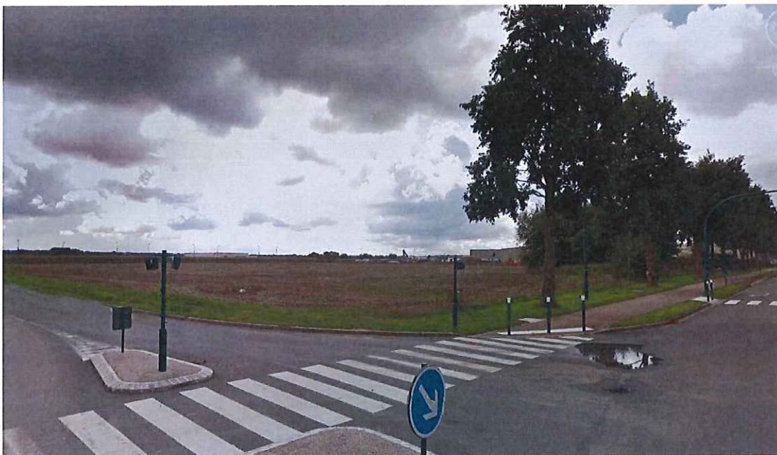
Vue depuis la RD406