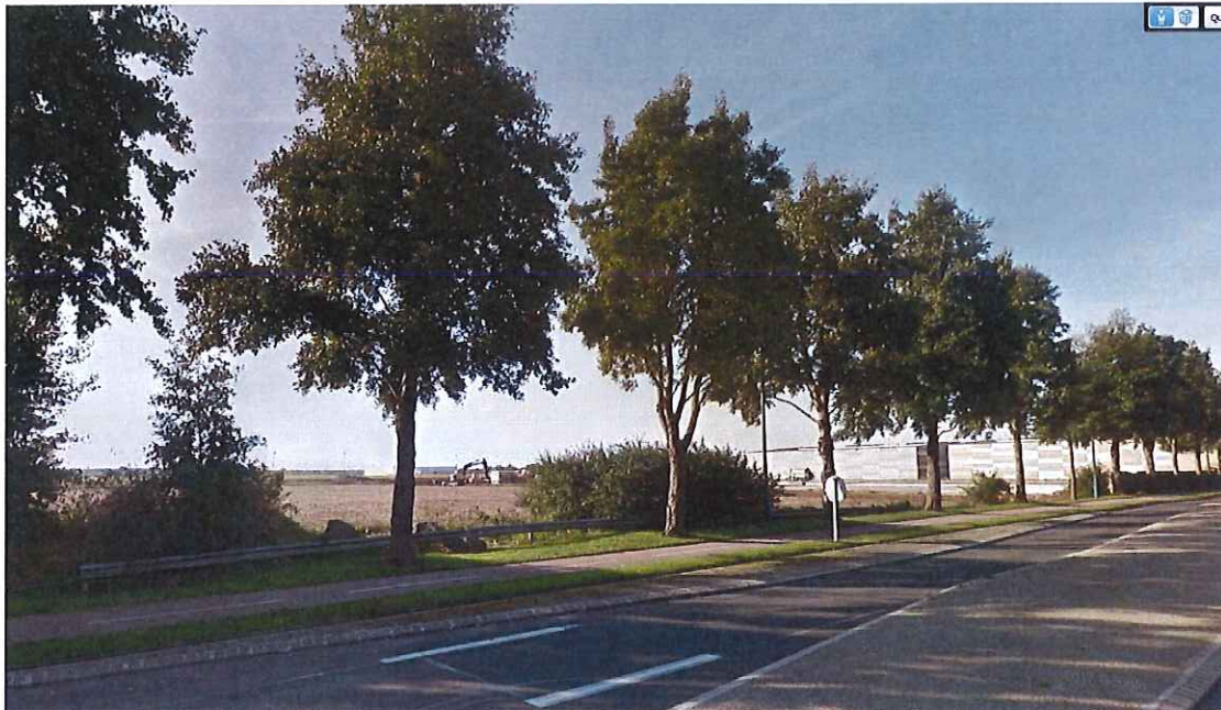
Vue depuis la Rue Pierre Gilles de Gennes