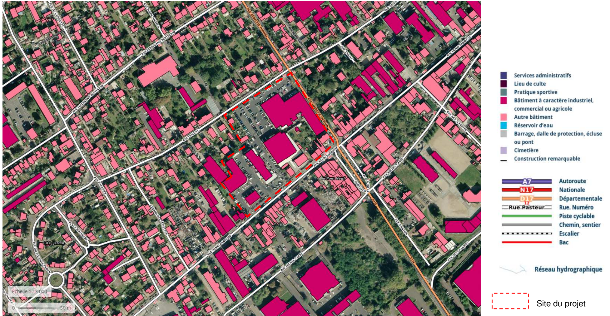
Figure 12 : Occupation des sols sur la commune d'Argenteuil au abord du site d'étude