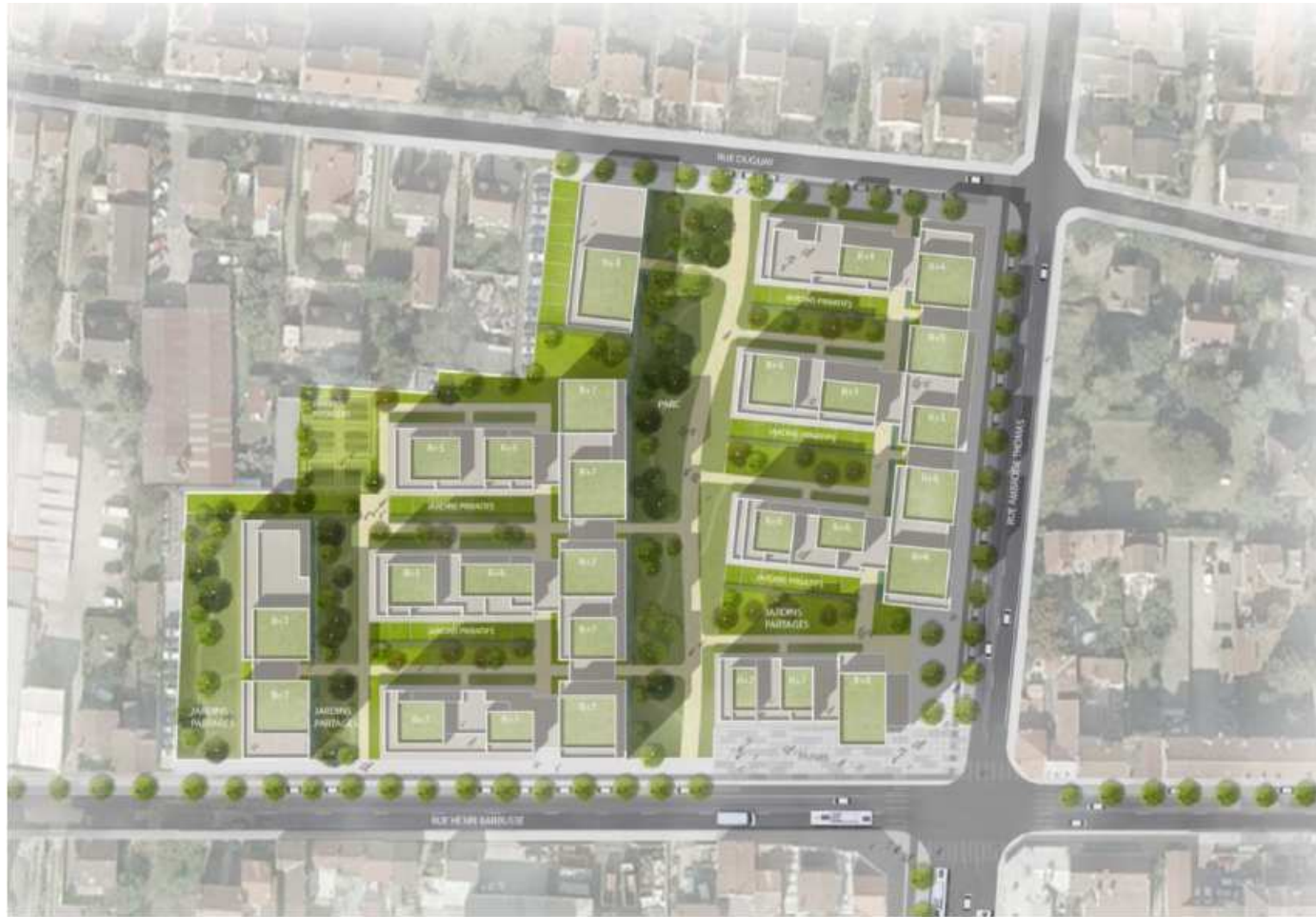
Figure 10 : Plan du projet d'aménagement