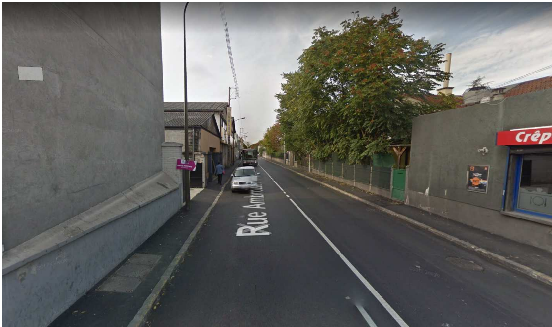
Figure 8 : Vue n°6 depuis le croisement entre les rues Ambroise Thomas et Duguay