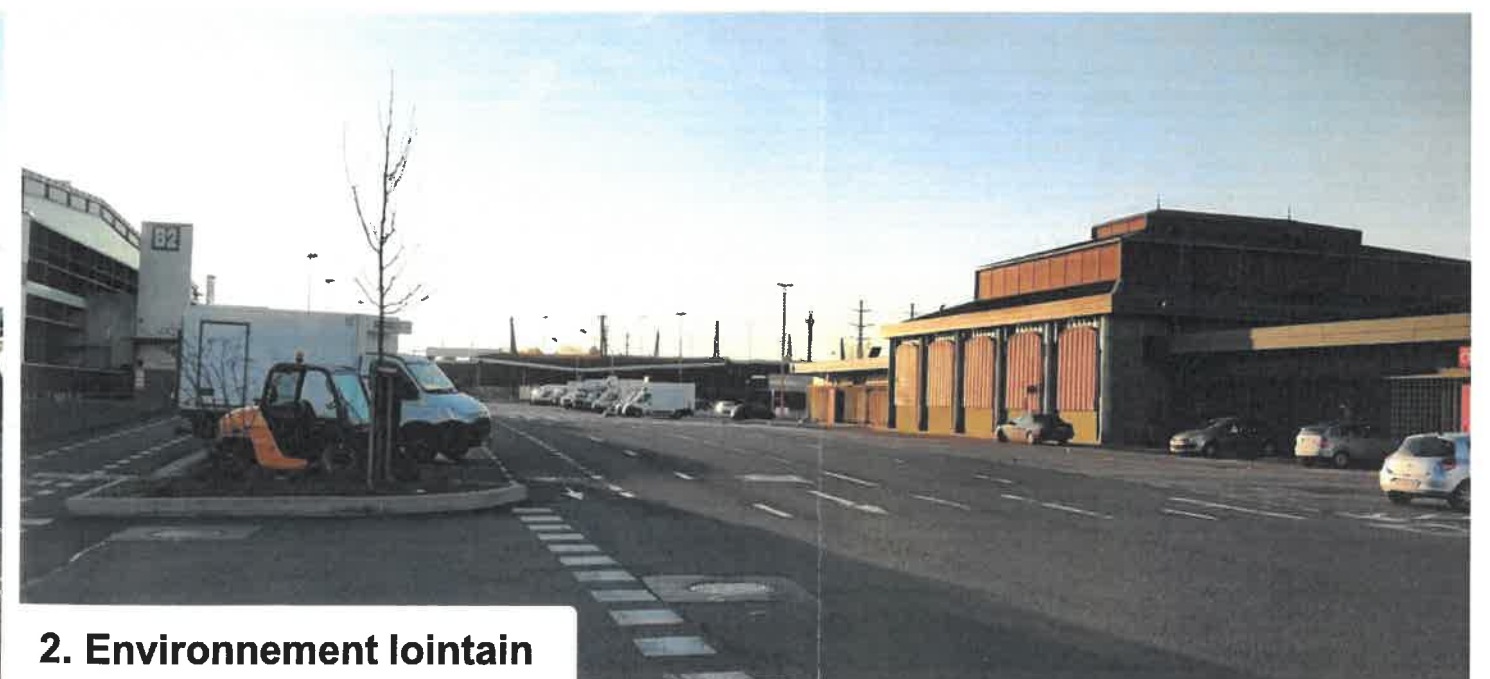
2. Environnement lointain