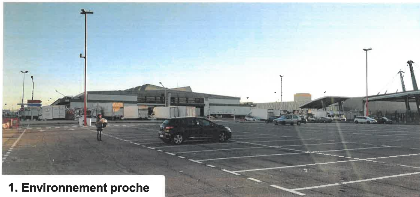
1. Environnement proche

SOCIÉTÉ D'ÉCONOMIE MIXTE DU MARCHÉ DE RUNGIS Boite Postale n° 40316 94152 RUNGIS CEDEX Tél. 01 41 80 80 00