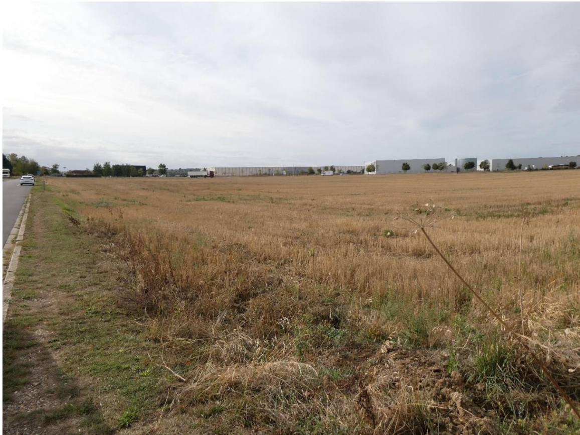
Photo 1 : Environnement proche du projet – Vue depuis le Chemin de la Vigne (IEA – Septembre 2020)