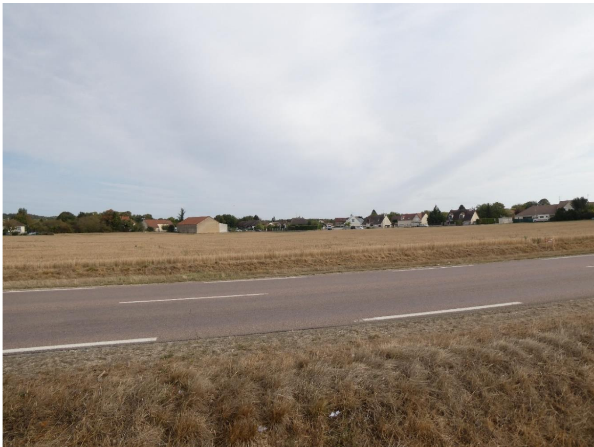
Photo 2 : Environnement proche du projet – Vue depuis l'autre côté de la RD 411 (IEA – Septembre 2020)