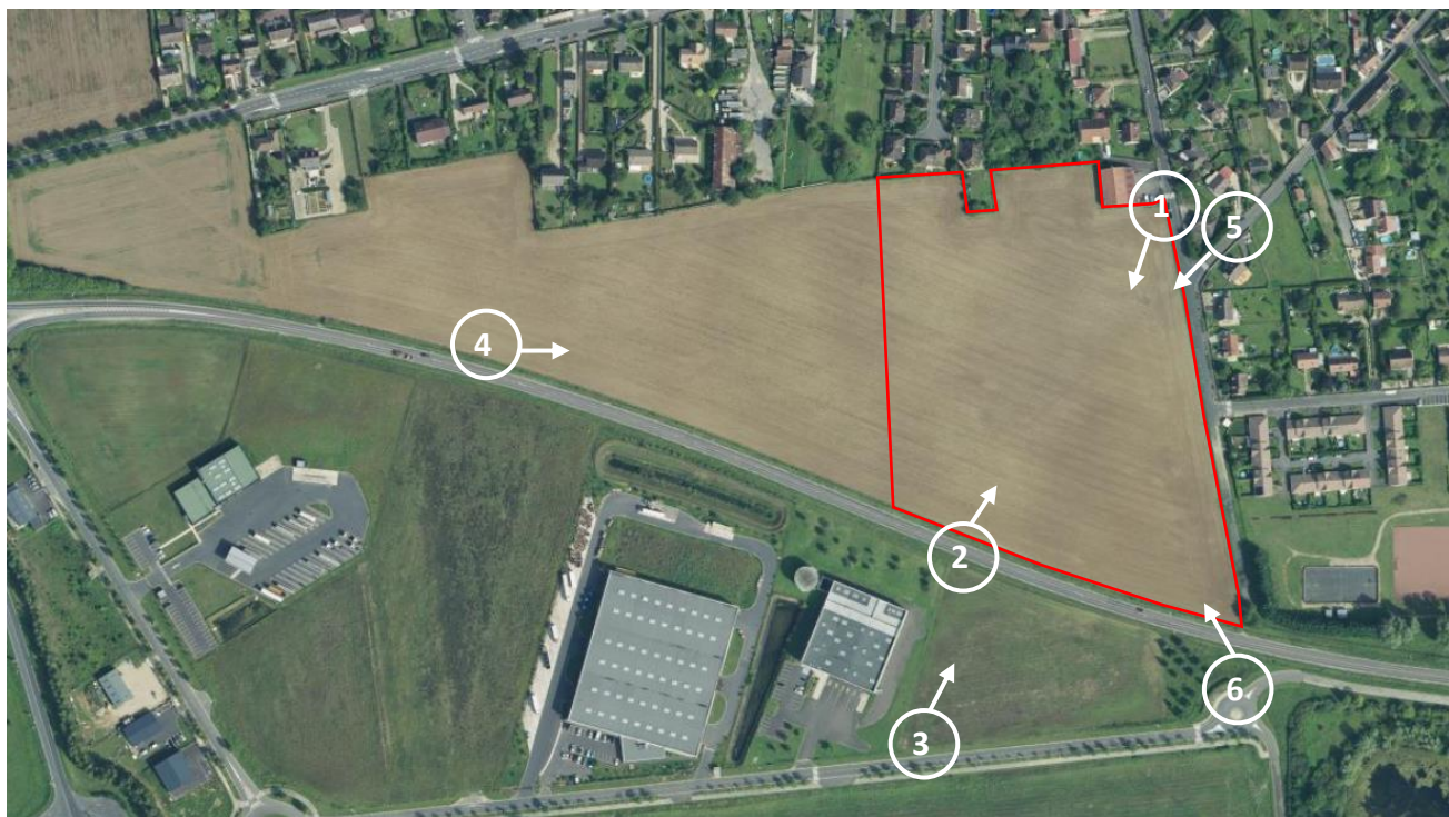
Carte 1 : Localisation des photographies (IEA)