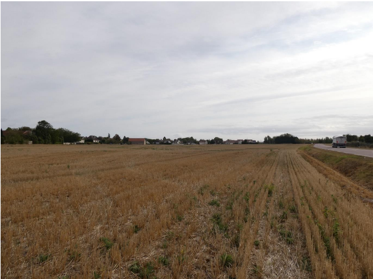
Photo 4 : Environnement lointain du projet – Vue depuis la parcelle agricole voisine (IEA – Septembre 2020)