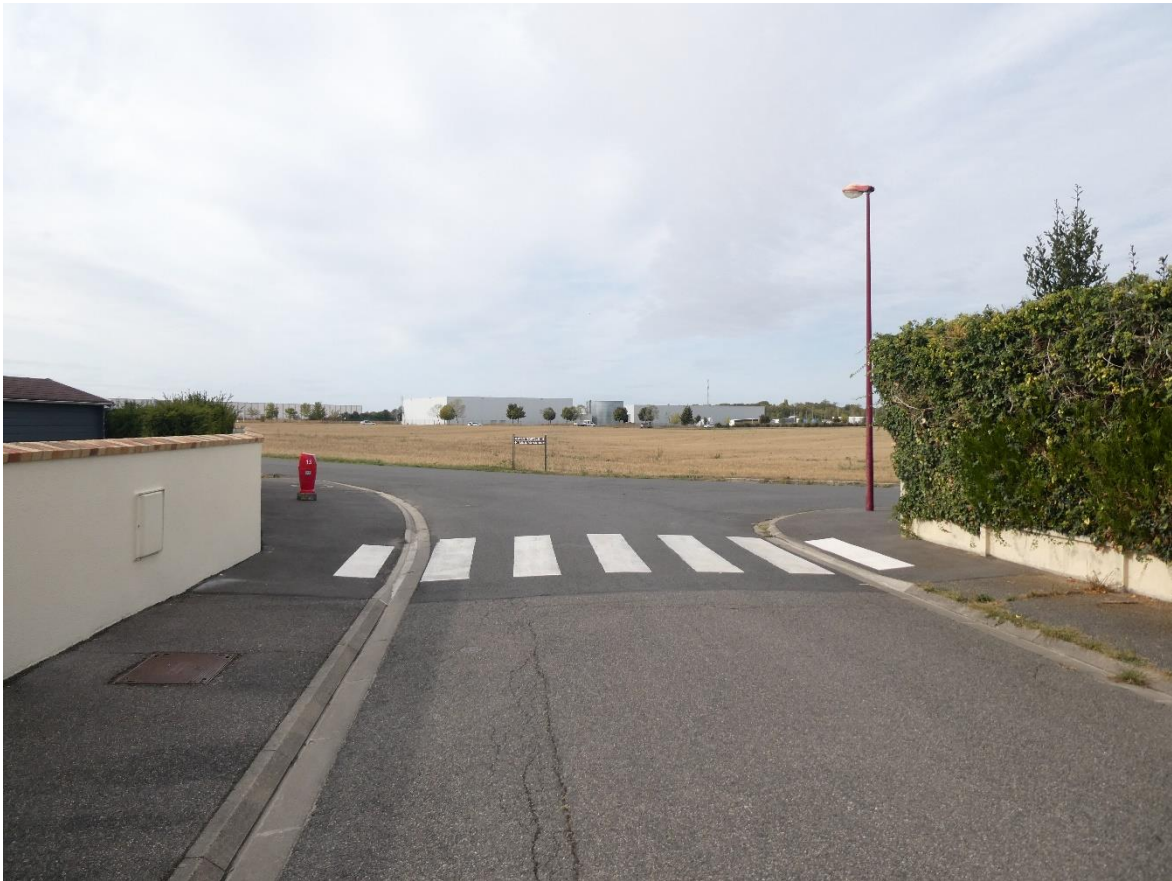
Photo 5: Environnement lointain du projet – Future entrée du lotissement depuis la rue Saint-Donain (IEA – Septembre 2020)