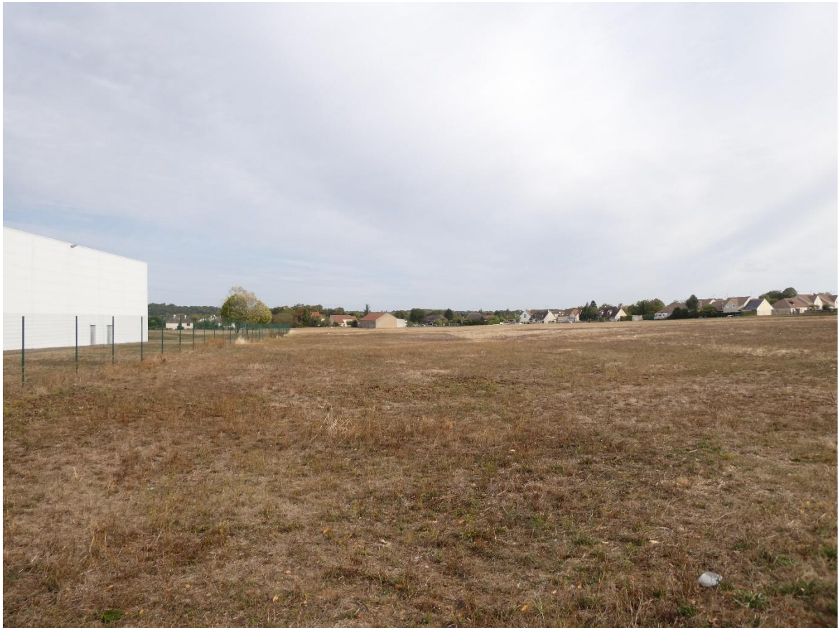
Photo 3 : Environnement lointain du projet – Vue depuis la ZAC de Saint-Donain