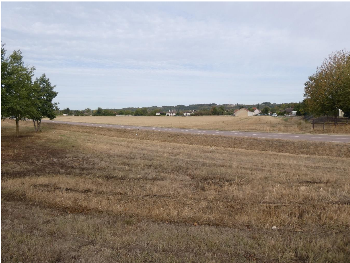
Photo 6 : Environnement lointain du projet – (IEA – Septembre 2020)