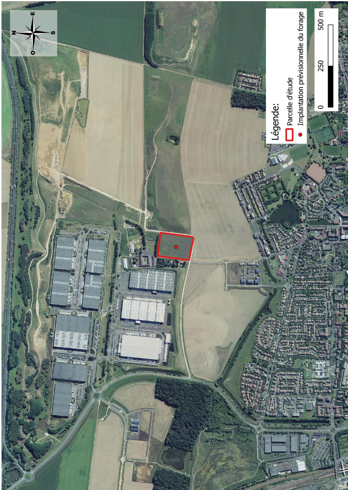
Implantation prévisionnelle du forage sur le site d'étude