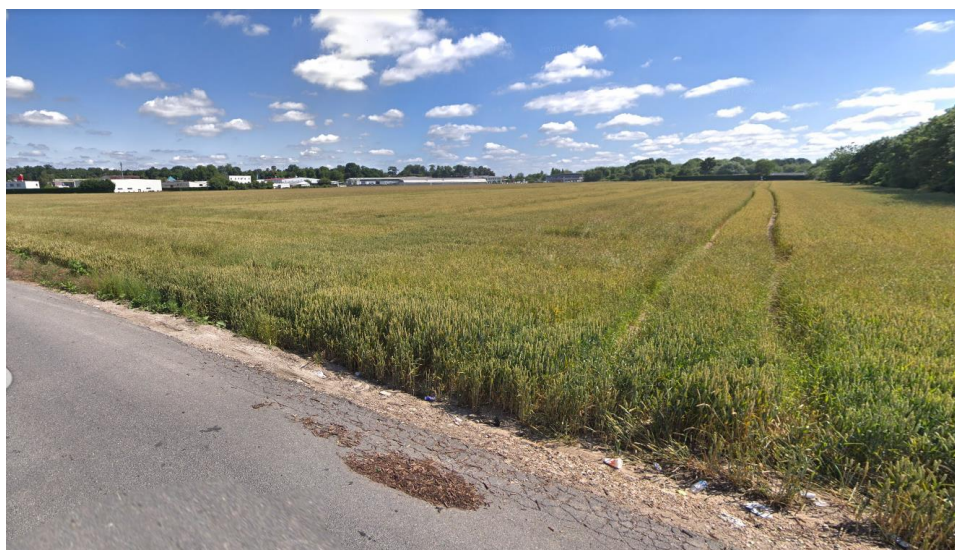
Figure 2 : Vue du site depuis le chemin de la Croix Saint Nicolas – Environnement lointain - Juin 2018