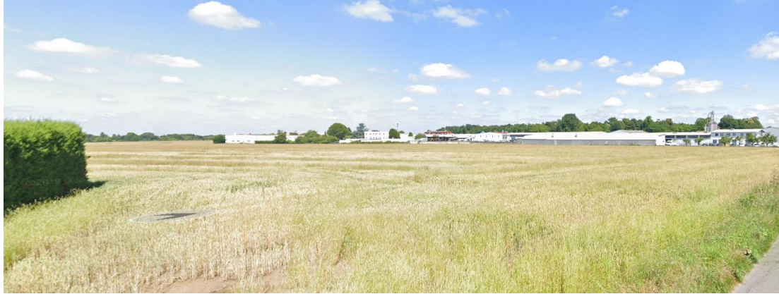
Figure 1 : Vue du site depuis le chemin de Brie – Environnement proche - Juin 2018