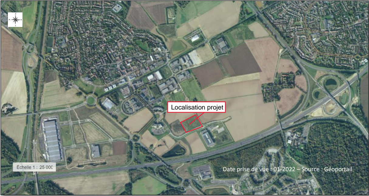
Situation du projet environnement lointain