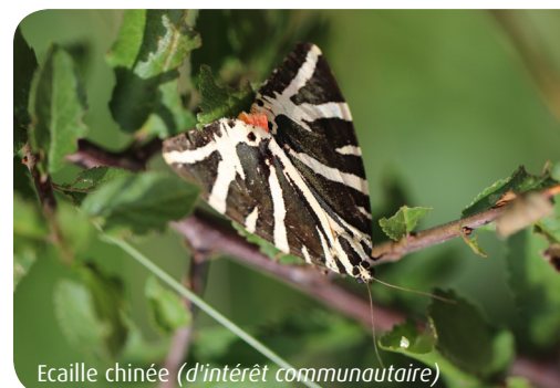
Eaille chinée ( d'intérêt communautaire )

Espèces rencontrées dans les pelouses calcaires