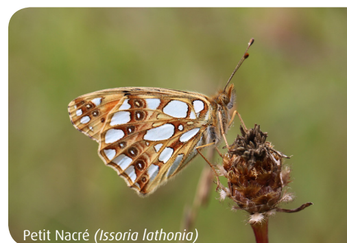
Petit Nacré ( Issoria lathonia )