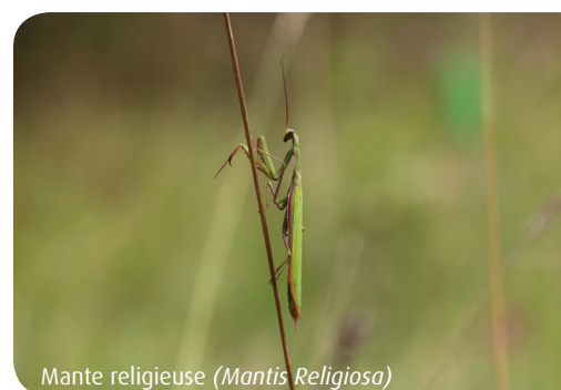
Mante religieuse ( Mantis Religiosa )