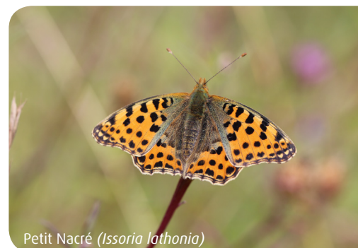
Petit Nacré ( Issoria lathonia )