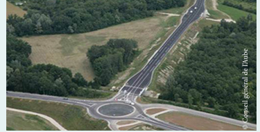
Vue aérienne de la rocade sud-est de Troyes

Les acteurs du DÉPARTEMENT DE L'AUBE bénéficient, depuis plusieurs années, d'une acculturation à l'écologie industrielle et territoriale, grâce notamment à la proximité de l'Université de Technologie de Troyes (UTT). En 2003, la création du Club d'Écologie Industrielle de l'Aube (CEIA) a permis de sensibiliser les industriels et les décideurs politiques du département.