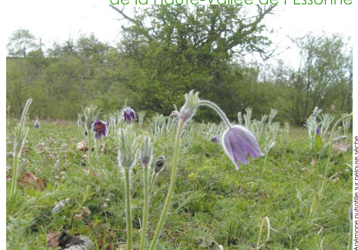
Anémone pulsatilla sur pelouse sèche

Une gestion concertée pour préserver les milieux et les espèces remarquables de la Haute-Vallée de l'Essonne