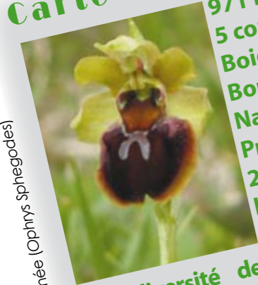
Ophrys araignée (Ophrys sphegodes)

971 ha 5 communes : Boigneville, Buno-Bonnevaux, Buthiers, Nanteau-sur-Essonne et Prunay-sur-Essonne 2 départements : l'Essonne et la Seine-et-Marne. Une diversité des sols (sables, grès de Fontainebleau, couches calcaires, limons marno-argileux) favorise la présence d'une mosaïque d'habitats (landes, pelouses calcaires, marais, forêts alluviales...) où vit un cortège d'espèces qui sont rares ou menacées au niveau européen (orchidées, papillons...). Ces milieux typiques du territoire du Gâtinais français sont uniques pour la Région Ile-de-France et regroupent également au moins 24 espèces végétales et 14 espèces d'insectes protégées au niveau régional et national.