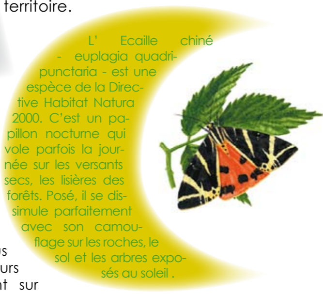
L' Ecaille chiné - euplagia quadri-punctaria - est une espèce de la Directive Habitat Natura 2000. C'est un papillon nocturne qui vole parfois la journée sur les versants secs, les lisières des forêts. Posé, il se dissimule parfaitement avec son camouflage sur les roches, le sol et les arbres exposés au soleil.

Susceptibles d'évoluer vers des formations boisées (sans grand intérêt sylvicole) il est nécessaire de maintenir ouverts ces espaces pour conserver la biodiversité du territoire.