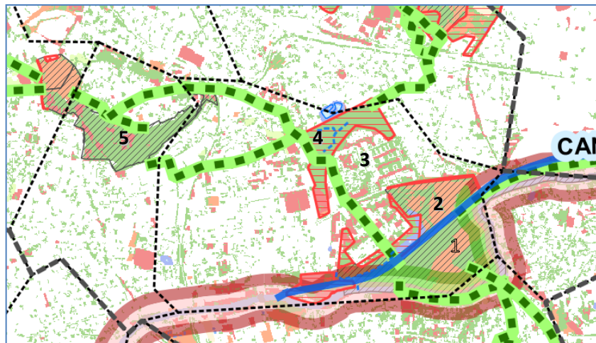
Extrait du SRCE d'idf

Dans les zones où les herbacées se développaient en hauteur, au nord du site notamment, de belles populations d'orthoptères s'étaient installées.