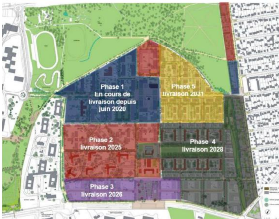
Phasage de la ZAC (2021)

Le dossier soumis à consultation publique éclaire en partie ce point. En 2016, la DRIEE a demandé la réalisation d'un dossier « Espèces protégées ». En 2017 il a été considéré qu'il n'y avait pas d'atteinte sur la phase 1 et mais qu'il était nécessaire de réaliser une mise à jour écologique et une évaluation des impacts des phases 2, 3 et 4 de la ZAC. De nouvelles études ont abouti à la rédaction du dossier de dérogation « Espèces protégées », objet de la présente consultation électronique, qui porte sur les phases 2, 3, 4 et 5 de la ZAC.