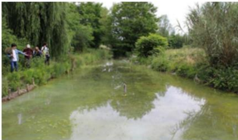
La mare au printemps 2020