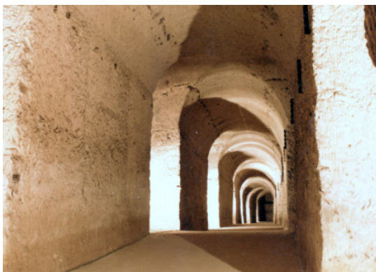
Ancienne carrière souterraine Arnaudet Meudon