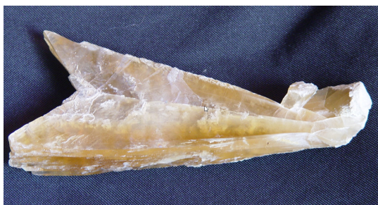
Fer de Lance

www.driee.ile-de-france.developpement-durable.gouv.fr