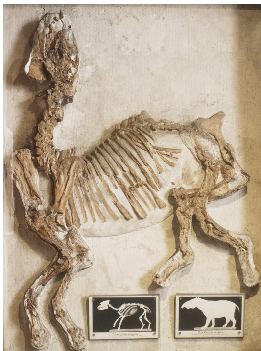
Paleotherium du Ludien (Vitry-sur-Seine - 94)